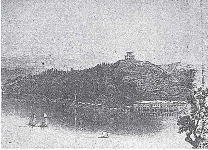
Resim 1: 1828 yılında inşa edilen kışla (Tepede İcadiye Kasrı)