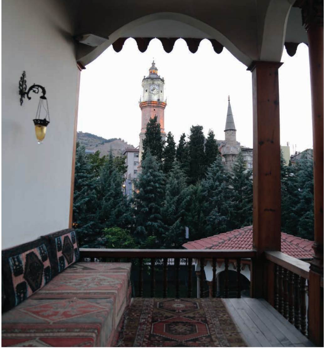
Tokat Mevlevihanesi'nden Saat Kulesi

Mehmed Dede zamanında Mevlevihâne'nin gelirlerinin azalmasında 1701 yılındaki Tokat yangınının büyük rolü vardır 5 . Bu yangında Mevlevihâne'den neredeyse hiç eser kalmamış ve gelirleri de büyük oranda harap olmuştur. Mehmed Dede, 1703 yılında Mevlevihâne'yi ayağa kaldırmış ve yeni gelirler bağlamıştır 6 .