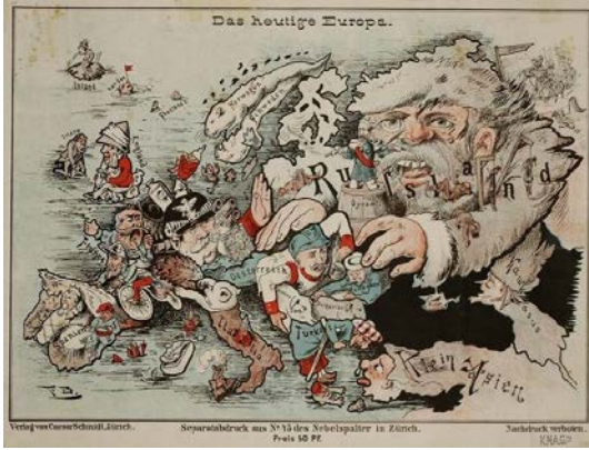
Fig. 3. Bugünkü Avrupa, 1887 (İsviçre)