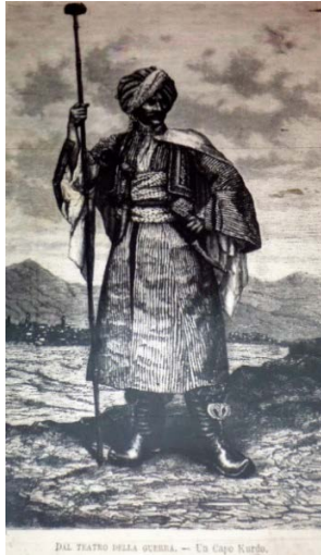
Fig. 6. Kürt Lideri