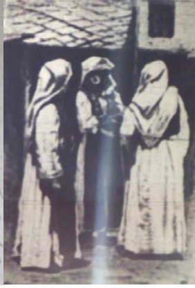
Fig. 10. Bosnalı Kadınlar