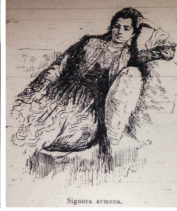
Fig. 11. Ermeni Kadın