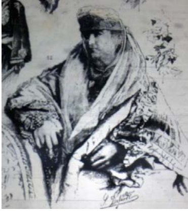
Fig. 9. Çerkez Kadın