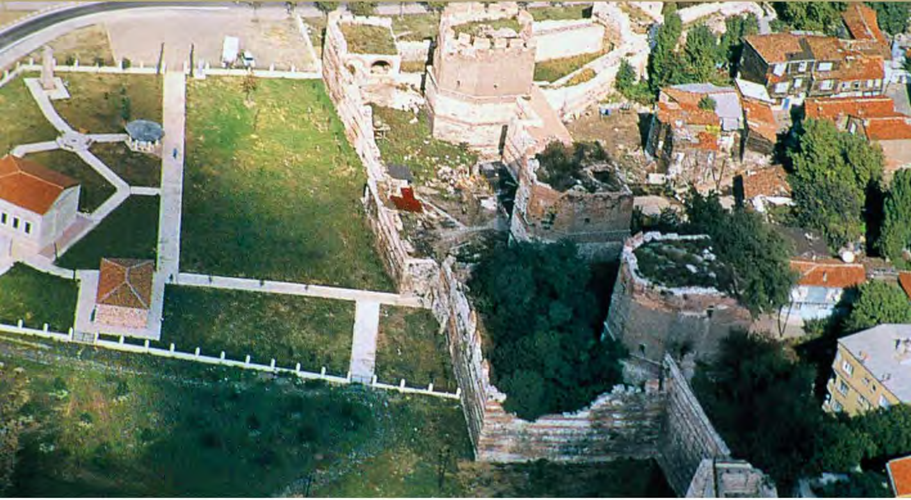
Animas Zindanları ve Ayvansaray surları.