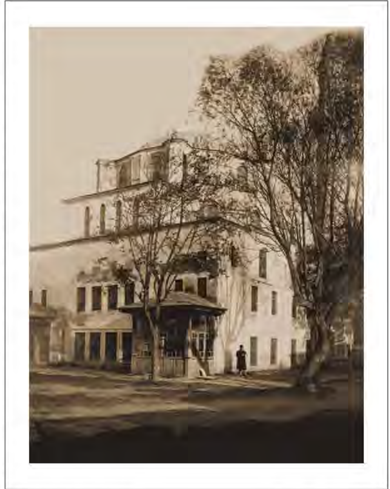
İvaz Ağa Camii. 1944 yılı

Geçtiğimiz yıllarda Ferudun Gümüş tarafından yapılan araştırma neticesinde Anemas Zindanları yakınındaki çay bahçesinde iki adet korent bulunmuştur. Bunlardan birisinin başlığı ve sütunu ters dönmüştür. Yüksekliği 1.70 m. Başlık alt çapı 0.45 m.'dir. İkincisi ise Ayvansaray-Eğrikapı arasında yer alan ve Hz. Meryem'e ithaf edilmiş Rum Kilisesi'nin Aya Zoni'ye ait ayazmanın dışındadır. Epey tahrip olmuş bu paçanın Rum Kilisesi'nin üstüne oturduğu eski Bizans kalıntısına ait bir parça olduğu tahmin edilmekte ve 5. yüzyılın sonlarına tarihlenmektedir 13 .