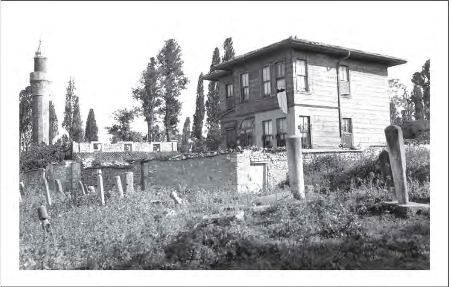
Emir Buhari Tekkesi. 1936 yılı

Arap idaresinde bulunduğu sırada, buranın son idarecisi ve kumandanı Abdülaziz el-Kuturbî, Kandiya'yı Bizans kuşatmasına karşı uzun süre direnmiş ancak 1961 yılında ada düşmüştür. Bunun üzerine kumandan esir olarak Byzantion'a getirilmiş ve zorunlu ikamet etmeye mecbur edilmiştir.