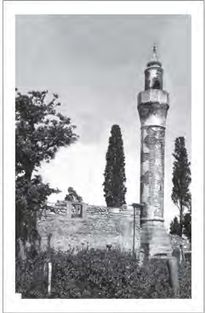
Emir Buhari Tekkesi 1942 yılı