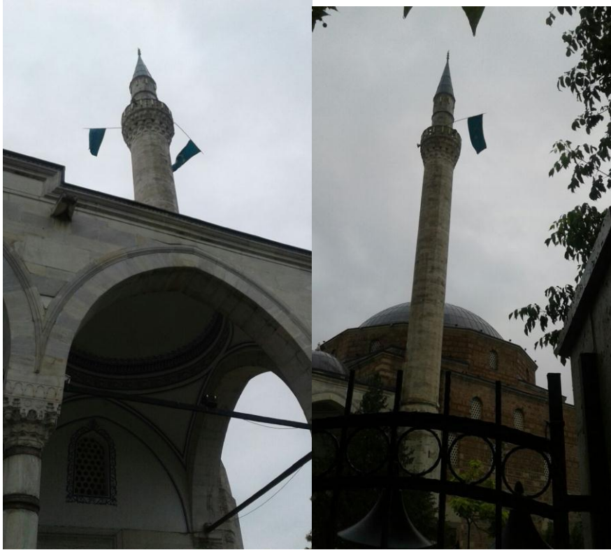
Resim 5.Üsküp İsa Bey Cami (2017 Mayıs)*