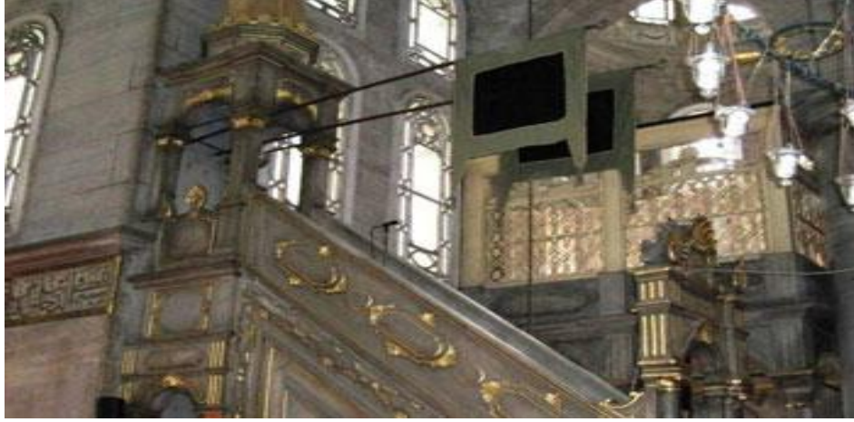
Resim 1. Eyüp Sultan Cami Minberindeki siyah sancaklar. 17

Başka bir bakış açısından ele alındığında; Gazi el-Hac Evranos bini İsa' nın 818 H.71415 M. tarihli vakfiyesinde, Peygamber aleyhis-selâm'ın “ vakıf kıyamet gününde mü'minin gölgesidir, sadaka rabbın gazabını söndürür ” 18 ifadesinde ise Allah rızası için kurulan vakfın, mecâzi anlamda kıyamet gününde vâkıf için gölgesine sığınılacak bir bayrak ve onu Allah katında yüceltecek bir davranış olduğunu söylemek yanlış olmaz.