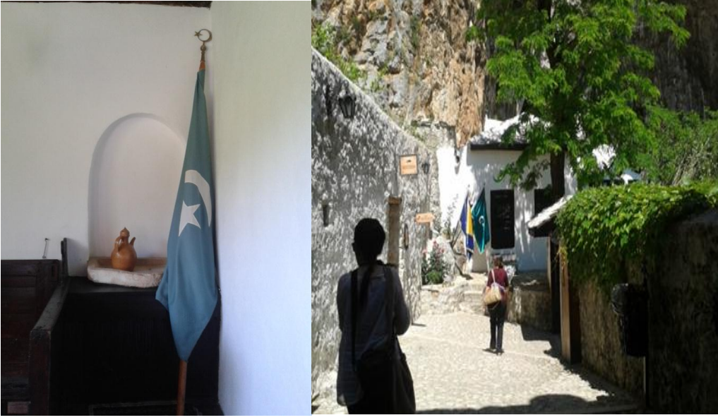
Resim 5 a-b. Blagay Tekkesi-Mostar ( Nilgün Çevrimli 2014).

Balkanlarda sıklıkla rastlanan bu geleneğin ülkemizde de sınırlı da olsa bazı örneklerde yaşatıldığı anlaşılmaktadır.