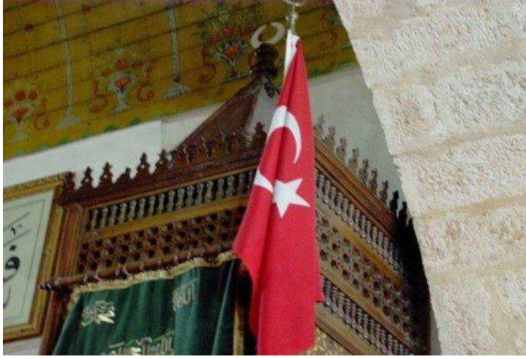
Resim 7. Kahramanmaraş Ulu Cami Minberi

Balkanlarda sıklıkla rastlanan bu geleneğin ülkemizde de sınırlı da olsa bazı örneklerde yaşatıldığı anlaşılmaktadır.