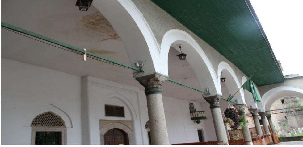
Resim 2.Saraybosna Fatih Cami (Nilgün Çevrimli 2014)

2014 yılında Saraybosna Fatih Cami'nin son cemaat yeri kemer girişlerinde, Mostar'da Koski Mehmet Paşa Cami, Poçitel Şişman İbrahim Paşa Cami minberlerinde bir yanda yeşil üzerine beyaz ay-yıldızlı Osmanlı bayrağı ile kırmızı üzerine beyaz ay-yıldızlı Türk bayrağının asıldığı bizzat gözlemlenmiştir.