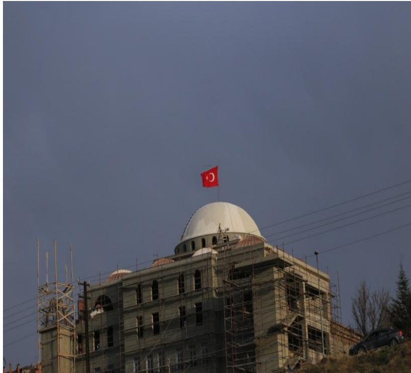
Resim 9.Cami Kubbesi İnşaatı Ankara

Bu geleneğe istinaden günümüzde cami inşaatlarının kubbe, minare inşasının bitimi aşamalarında da Türk bayrağının zaman zaman bu yapılarda dalgalandırıldığına da şahit olunmaktadır.