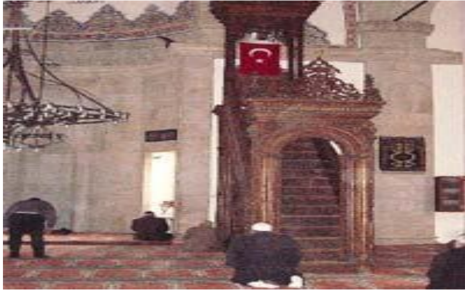
Resim 8. Malatya-Ulu Cami 26

Bu geleneğe istinaden günümüzde cami inşaatlarının kubbe, minare inşasının bitimi aşamalarında da Türk bayrağının zaman zaman bu yapılarda dalgalandırıldığına da şahit olunmaktadır.