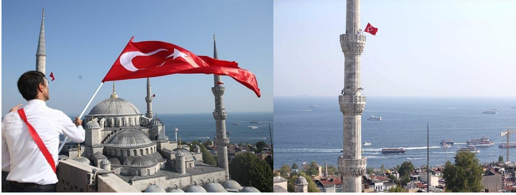
Resim 11a-b.Sultanahmet Camisi 28 2016