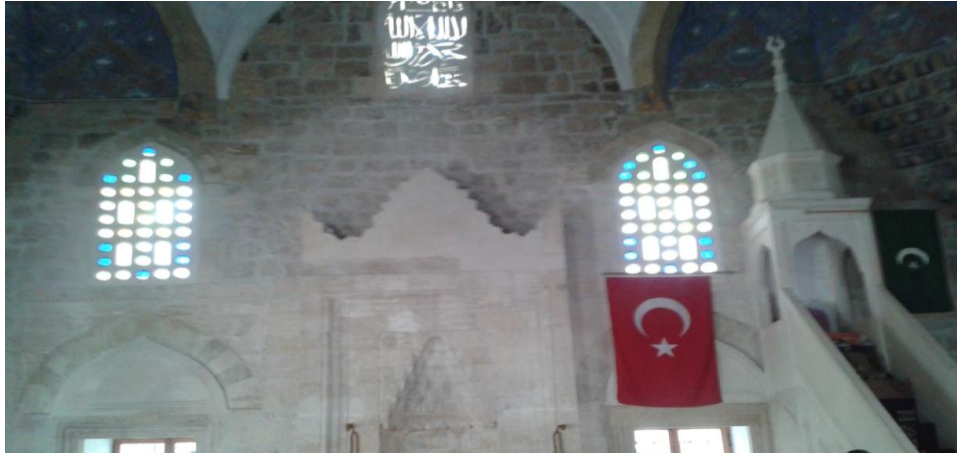
Resim 3. Poçitel-Şişman İbrahim Paşa Cami (Nilgün Çevrimli 2014)