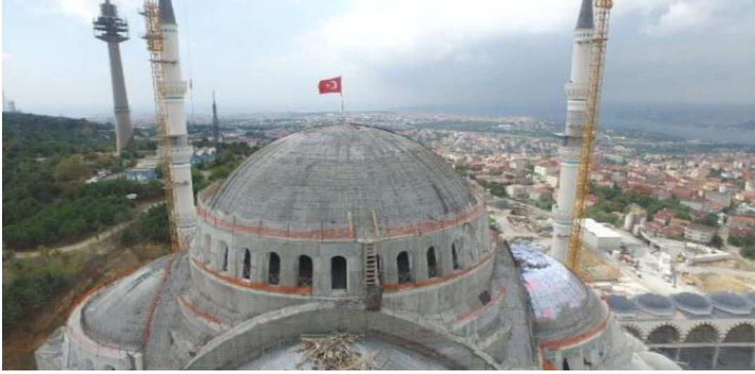
Resim 10. Çamlıca Cami 27