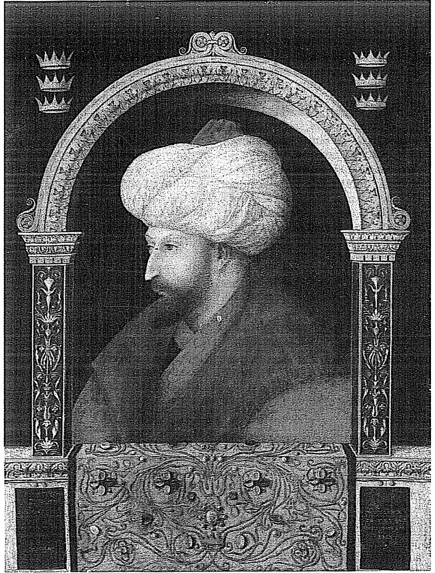
G. Bellini'nin yaptığı Fatih Portresi (Londra, Milli Galeri)

"Umumiyetle artiritik bünyelerde görülüp hemen bütün Osmanlı Pađışahlarına âriz olan damla (Goutte-Nikris) hastalığı ile müzmin romatizma gibi sair bedenî hastalıklara müptela olan Fatih -ki tablolarında da görülmektedir- geçiş sırasında daha da hastalanarak (inşidad) bütün müzmin hastalıklarına (emraz-ı müzmine) azan âzâlarının (ahlat-ı redie) tıkanması (insidad) eklenince, yatağa düşmüş ve kendisine önce ilm-i tıpdâ gayet mahir