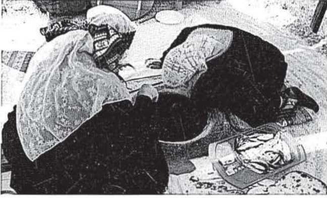
Resim 2 • Tandırda açık ekmek ve Van Gölü balığının pişirilmesi