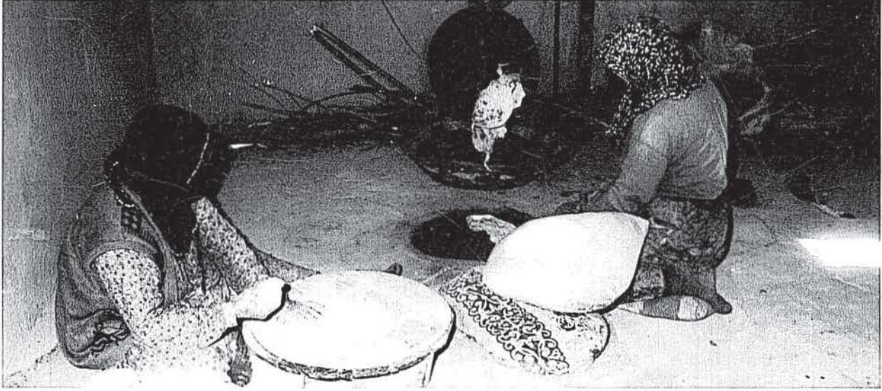
Resim 1 • Tandırda ekmeğin pişirilmesi

17. yüzyılın ortalarında Van'a gelen ünlü Türk gezgini Evliya Çelebi, Van'da pişirilen ekmeğin kalitesini ve lezzetini büyük bir övgü ile anlatmaktadır: "... Beyaz pamuk gibi lavaşı, katmer çiçeği, kelik böreği ve özellikle anasonlu, hoş beyaz somunu başka bir diyarda yoktur..."