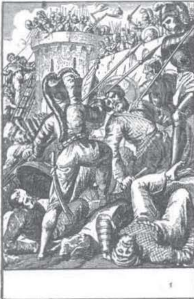
Yeniçerileri bir muharebe esnasında gösteren bu eski resim bir muharip yeniçeri kıyafetini göstermek bakımından dikkate şayandır

4 — Şahinci, yuvacı, kayacı, okçu ve saire gibi muayyen bir hizmet mukabilinde dirliğe sahip olanlar. Şahinci, yuvacı ve kayacılara mahsus tımarlara doğancı tımarı denirdi. Bunlar saray için av kuşu arar, bunları sarp mevkilerdeki yuvalarından yavru iken alıp terbiye eder ve zamanı gelince hükümdara takdim ederlerdi. Okçular ise, ordu ihtiyacı için lâzım olan okları yaparlardı.