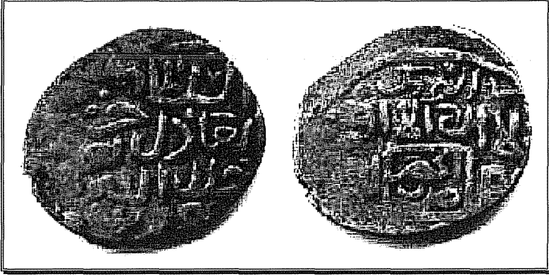
Resim 1: Akkoyunlu hükümdarı Sultan Yakup (1478-1490) adına Hasankeyf'te basılmış sikke 36 .

Akkoyunlu Devleti'nin Hasankeyf'teki hâkimiyetleri uzun süreli olmamıştır. Uzun Hasan'ın 1478'de ölmesiyle Sultan Halil, Akkoyunlu tahtına çıkmıştır. Ancak kendisine muhalif olan odaklar bulunmaktadır. Onların faaliyetleri neticesinde devlet içerisinde karışıklıklar nüksetmiş, babasının yerine tahta çıkan Sultan Halil, kardeşleri ile saltanat mücadelesine girişmiştir. Nihayetinde Sultan Halil, 1478 yılında kardeşi Yakup'la yaptığı savaşta ölmüştür 37 . Uzun Hasan'ın ölümünden sonra Akkoyunlu Devleti'nin kendi içinde yaşadığı karışıklıklar, Eyyubiler'in Hasankeyf'i yirmi yıllık inkıta döneminin ardından tekrar ele geçirmelerine zemin hazırlamıştır. 1482 yılında Hasankeyf'de Eyyubi hâkimiyeti tekrardan başlamıştır.