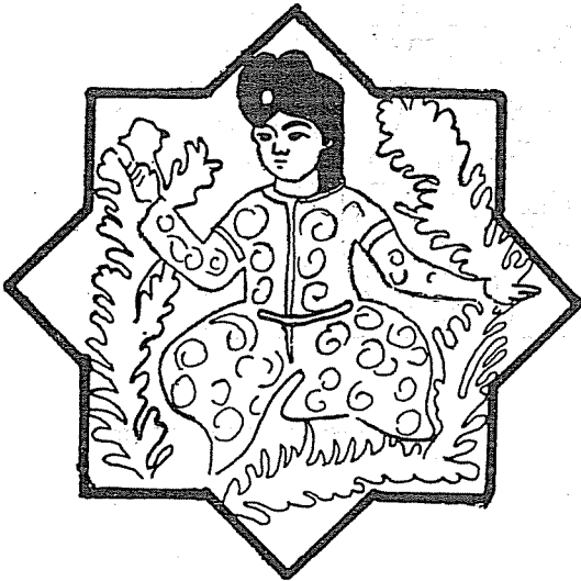
Resim : 3