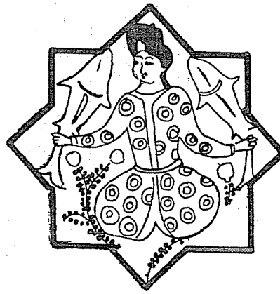
Resim : 4