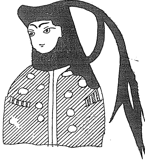
Resim : 7

Kubâd - âbâd Sarayı Duvar çinileri üzerinde Selçuklu kadın başlıkları ve giyimleri