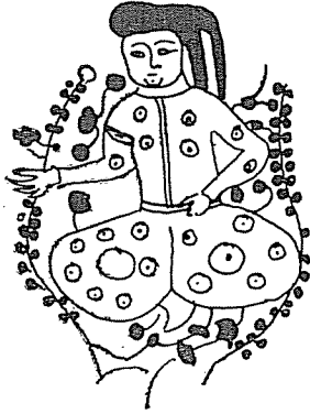
Resim : 6