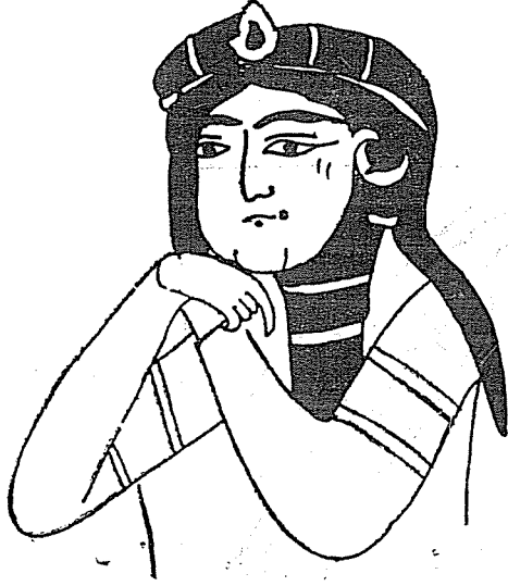
Resim : 1