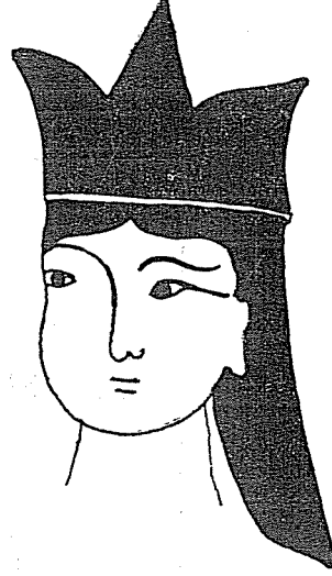
Resim : 2