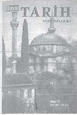
Bursa'da Emîr Sultan Camiî.