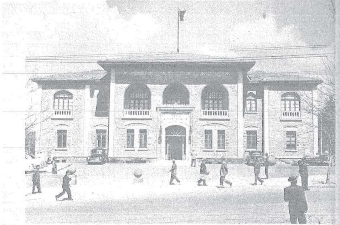
40 yıl müddetle Büyük Millet Meclisi'nin toplandığı, eski Türkiye B. M. Meclisi binası.

(1226), Doktor Refik Bey (Saydam) (1225), Süleyman Sırrı Bey (1223), Hamdullah Suphi (1213), Ali Rıza Bey (1202), Akçuraoğlu Yusuf Bey (1183), İsmail Canbulad Bey (1181) rey.