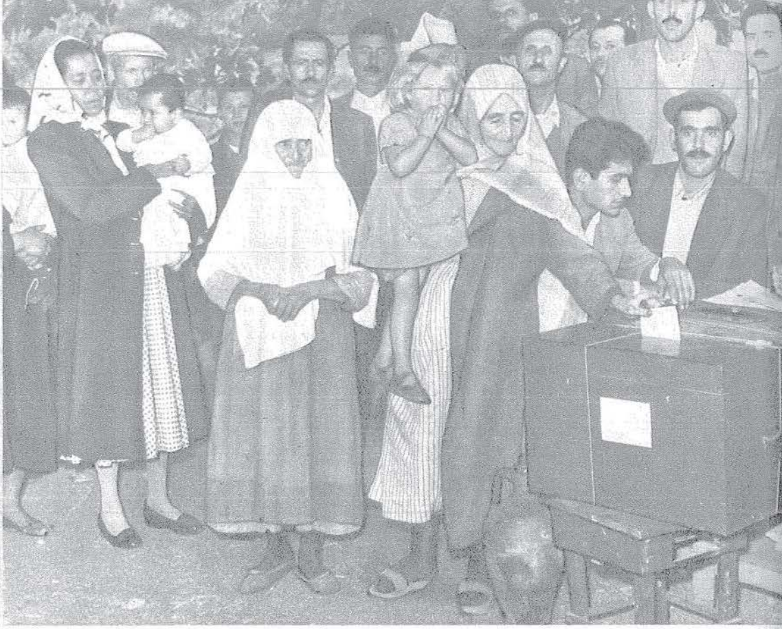
Zamanımızda tek dereceli olarak yapılan seçimde, oy kullanan bir vatandaş topluluğu...

Bu seçimde eski muhaliflerden üç kişi müstakil olarak namzetliklerini koymuşlar, bunlardan Mizancı Murad Bey 8, eski Tokat mebusu İsmail Paşa 6, eski Dersim mebusu Lütfi Fikri Bey 6 rey almışlardı.