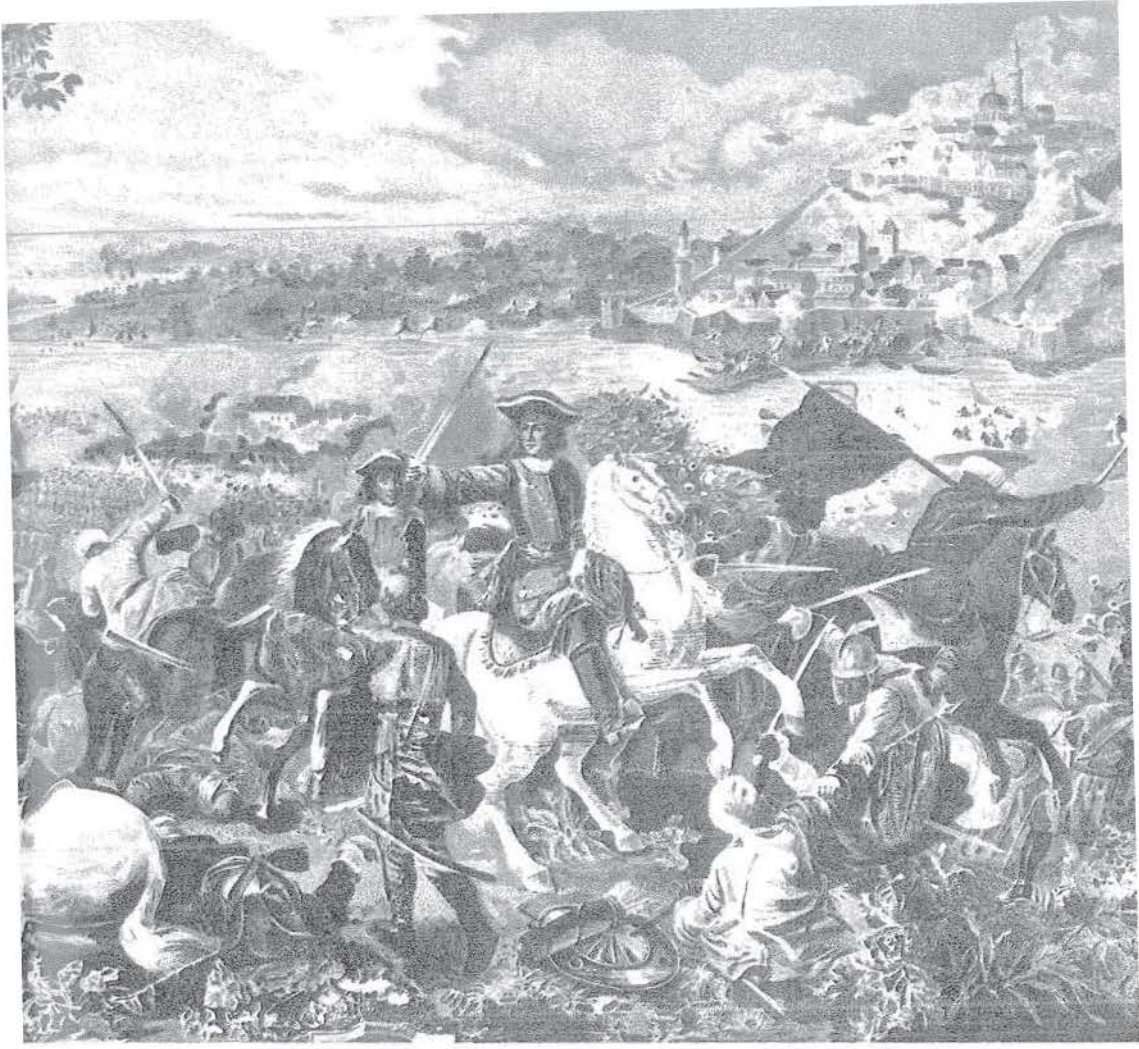
Viyana muhasarasını kaldırarak çekilen Türk ordusunun Ciğerdelen'de yaptığı şiddetli savaştan bir görünüş.

na karşı düşmandan atılan top yuvarlaklarını tarttırıp esefe ve hayrete vardı. Ama ne fayda eder?