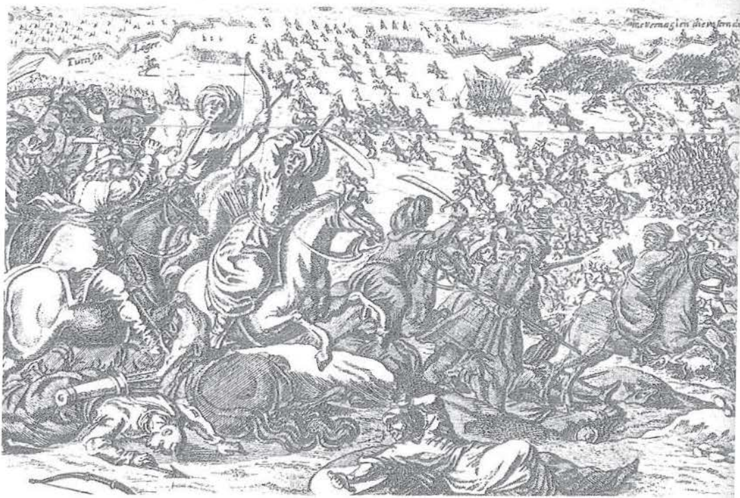
Türk ordusunun Avrupa'daki savaşlarından biri: St. Gotthard Savaşı.

bağış vermesini emretti. Kaleden tabura kaçan bir Nemçeli tutulup, taburda dokuz bin ve kalede on beş bin asker olduğunu Nemçe çarınının muhasaradan on gün önce kaçıp ve zevcesi ile yüzlerini yırtarak, saçlarını yolarak Linz şehrine gittiklerini haber verdi. İkindiden sonra Serdar'ın tabyada mehterhanesi çalmaya başladı. Yeniçeri ağası ve sağda, solda vezirler, beylerbeyleri ve ümeranın dahi mehterhaneleri katılınca gurubdan, yatsıdan ve fecirden sonraları her koldan çalınan davul, zurna, nekkare, zil sesleri, top ve tüfek sadaları ile birleşip yer ve gök titrerdi.