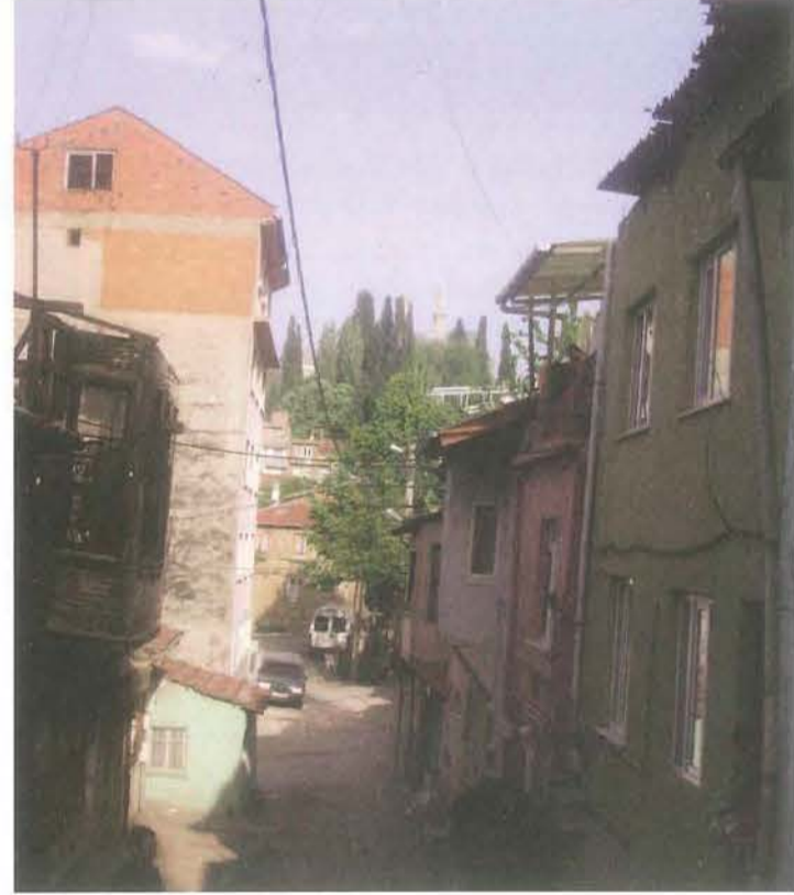
Resim 2: Bayezit Sokak

Günümüzde Yeşil'den eski Bayezid Paşa Mahallesi'ne gitmek için " Yeşil İmaret "nin doğusundan aşağıya, kuzeye inen " Uğurlu Sokak "ı takip etmek yeterlidir. Bu sokak aslında bir merdivenli sokak görüntüsünde uzanıp gider. Merdivenler iki kademe hâindedir. İlk kademedeyken sonra, önce " Uzun Aralığı Sokak ", otuz kırk basamaktan sonra da " Şible Caddesi " sokağı keser. Bu noktadan itibaren " Beyazıt Sokak " başlar. Beyazıt Sokak'a açılan " Çatal Çıkma " ve " Sevindi Sokak "ı da