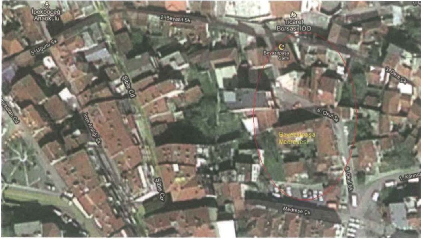
Resim 4: Bayezid Paşa Mahallesi Uydu Fotoğrafi

Her mahallede olduğu gibi Bayezid Paşa Mahallesi'nde de önemli kişiler yaşamış, medresede büyük âlimler görev yapmış, pek çok hayırsever evlerini, mülklerini, paralarını bu mahalledeki hayır eserlerine vakfetmişti. Her Bursa Mahallesi'nde olduğu gibi bu mahallede de "Mahalle Avârız Vakfı" kurulmuştu. Mesela bu vakfın 1205/1791 yılına âit muhasebe kaydı B 240 Numaralı Bursa Kadı sicilinde aynen şöyle yer almıştır: 10