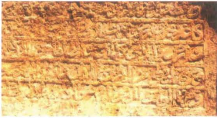
Resim 10: Amasya Kaya Kitabesi.

Bayezid Paşa, bu medrese ve camiinin masraflarını karşılamak için İnegöl'deki Helâlce, Fedalar ve İlarıslan köylerini satın alarak buraya vakfetmişti. Ayrıca yine İnegöl'de Akhisar Köyü'nde vakıf değirmenleri vardı. Bu iki eserine gelir getirmek düşüncesiyle Tahtakale'deki Yoğurt Hanı'nı da yaptırmış ve ayrıca 5 dükkân vakfetmiştir. Bu gün geride bir-iki duvar parçası kalan bu hanın alt katında 21, üst katında 25 odası olduğu bilinmektedir.