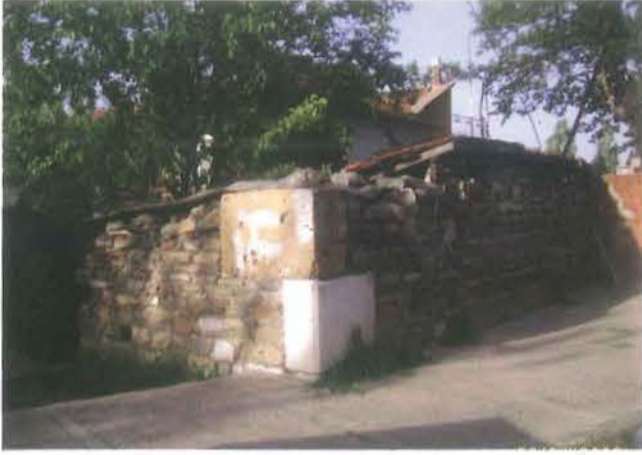
Resim 9: Medresenin Güney cephesinden kalıntılar

Bayezid Paşa, bu medrese ve camiinin masraflarını karşılamak için İnegöl'deki Helâlce, Fedalar ve İlarıslan köylerini satın alarak buraya vakfetmişti. Ayrıca yine İnegöl'de Akhisar Köyü'nde vakıf değirmenleri vardı. Bu iki eserine gelir getirmek düşüncesiyle Tahtakale'deki Yoğurt Hanı'nı da yaptırmış ve ayrıca 5 dükkân vakfetmiştir. Bu gün geride bir-iki duvar parçası kalan bu hanın alt katında 21, üst katında 25 odası olduğu bilinmektedir.