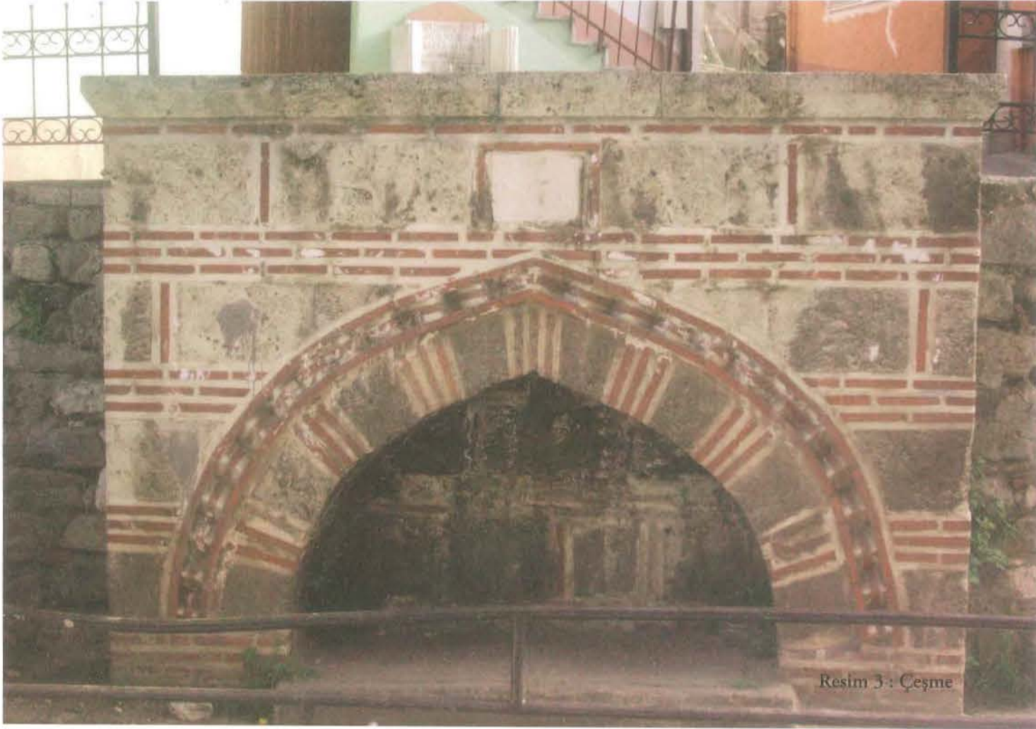
Resim 3: Çeşme

Barkan'ın yayınladığı "Hüdâvendigâr Livası Tahrir Defterleri"ne göre mahallenin üç ayrı tarihteki nüfus verileri şöyleydi: