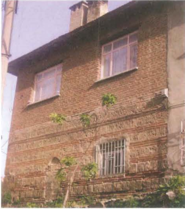
Resim 8: Medresenin Kuzey duvarı

Bayezid Paşa Medresesi: Caminin batı duvarındaki "Hocataşkın Mahallesi Okul Sokak" levhasını takip ederek yukarıya doğru biraz yürüyünce sağda, köşede bir evle karşılaşılır. Evin alt katı üç sıra tuğla, bir sıra kesme taşla örülmüştür. Alttaki duvar kalıntısı Bayezid Paşa Medresesi'ne aittir. Veziriazam Bayezid Paşa'nın Bursa'daki asıl hayratı bu medresedir. Mescidi bunun yanında çok küçük ve sönük kalmaktadır. Medrese, 1934 yılında yok pahasına satılmış, yerine evler yapılmıştır. Daha yıkılmadan önce A. Gabriel'in yaptığı doğu kolunu gösteren rölvösinden başka elimizde medrese binası hakkında bizi aydınlatacak pek fazla bilgi yoktur.