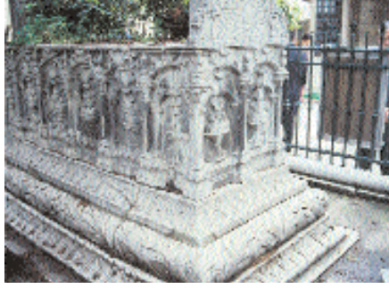
Resim 5. Saliba Sultan Lab-di'nin başşabidesi ve içe bakan yüzündeki bitkisel kompozisyon