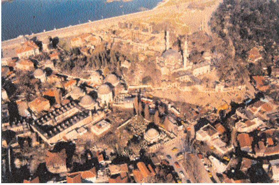
Resim 1. Eyüp Sultan Külliyesi ve çevresi