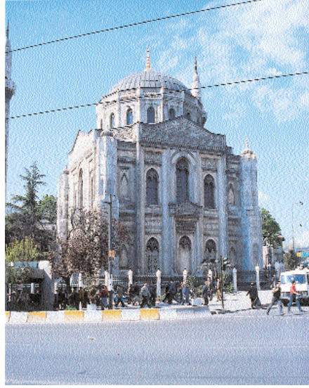
Resim 25. Aksaray Pertevniyal Valide Sultan Camii genel görünümü.

Sonuç olarak; Bilindiği gibi Osmanlı Türk Sanatında batılılaşma dönemi barok üslûpla başlamış ve barok