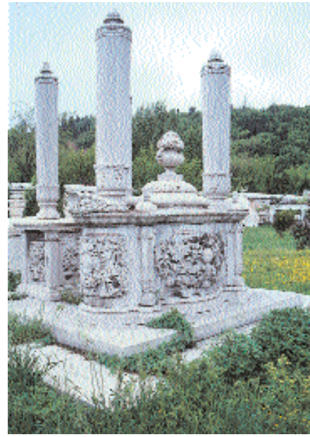
Resim 14. Rıfat Paşa Labdi'nin genel görünümü.