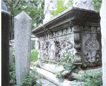
Resim 7. Es-seyyid Muhammed Salib Bey Labdi'nin yan cephesi