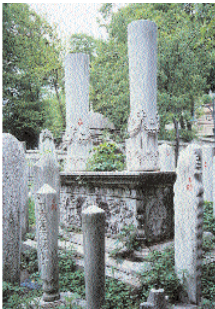
Resim 8. Es-seyyid Muhammed Salib Bey Labdi'nin genel görünüşü