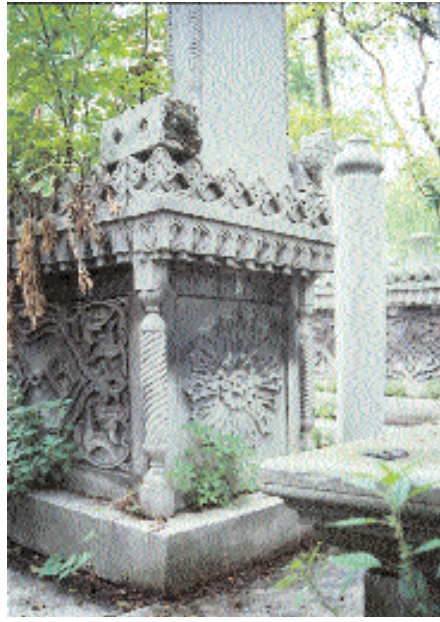
Resim 13. Şerife Aişe Atıyye Hanım Labdi'nin köşe detayı.