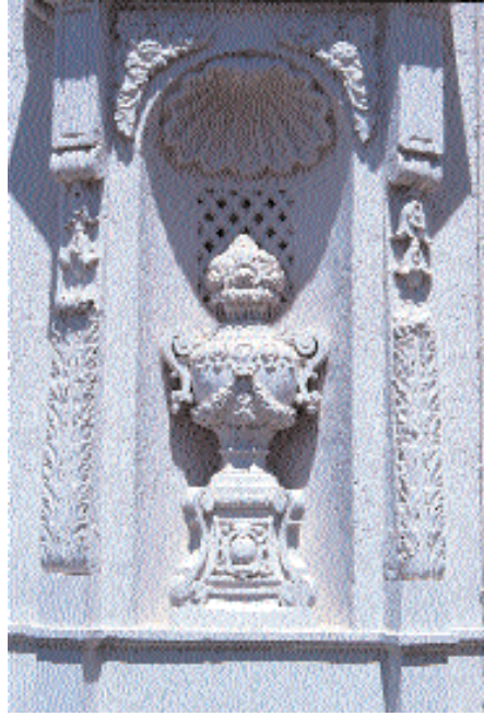
Resim 20. Mecidiye Köşkü'nün cephesinden detay.