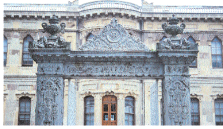
Resim 19. Küçükku Kasrı'nın bahçe girişinden detay.