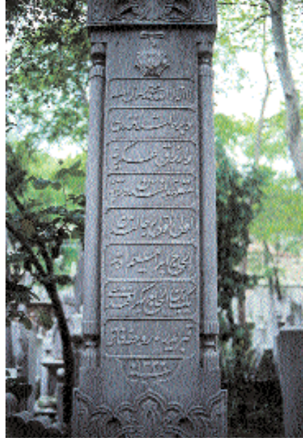
Resim 28. İbrahim Edhem Bey Lâhdi'nin ayak şabidesi ve kitabesi.