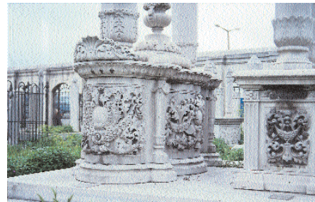
Resim 21. Rıfat Paşa Lahdi'nden görünüm.

Lâhdin üzerini örten kapak da silmelerindeki bitkisel süslemeleri ve dışa taşan durumuyla yine neo-klasik üslûbun bir ifadesidir. Kapağın üzerine oturtulan yüzeyleri yivli tepelikler, mimarîdeki ağırlık kuleleri gibi, alttaki sütuncelerle bağlantılı öğeler olarak görülmektedir.