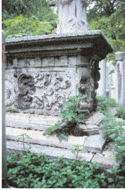
Resim 6. Es-seyyid Muhammed Salib Bey Labdi'nin köşe detayı

Şahidelerinden anlaşıldığı kadarıyla genellikle önemli kişiler için yapılan ve bazı örnekleriyle bu bildirin de konusunu oluşturan lâhit tipindeki mezarların 11.-12. yüzyıldan itibaren var oldukları bilinmektedir. 7 Ancak geçen zamanla birlikte bu mezar tipi öylesine zenginleşmiş ve çeşitlilik kazanmıştır ki, kendi içerisinde bir sınıflama yapma gereği doğmuştur. Bu anlamda kapsamlı bir çalışma yapılmamış olmakla birlikte spesifik konulara yönelik ve birbirini tamamlayan bilimsel çalışmaların var olduğunu biliyoruz. 8 Bu çalışmalarda ortaya konan lahit mezarlar başlığı altındaki sınıflama, belirli bir alanda ve sınırlı sayıda örnekler çerçevesinde yapılmıştır. Şüphesiz, başka örneklerin de katılımıyla bu sınıflamayı genişletmek ve daha da geliştirmek mümkündür. Nitekim, Süleymaniye Haziresi'nde ve II. Mahmut Haziresi'nde tesbit ettiğimiz bazı örnekler, genel olarak lâhit mezarlar grubuna girmekle birlikte