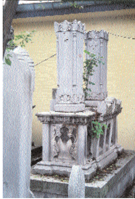
Resim 24. İbrahim Edhem Bey Lahdi'nin kuzeyden genel görünümü.