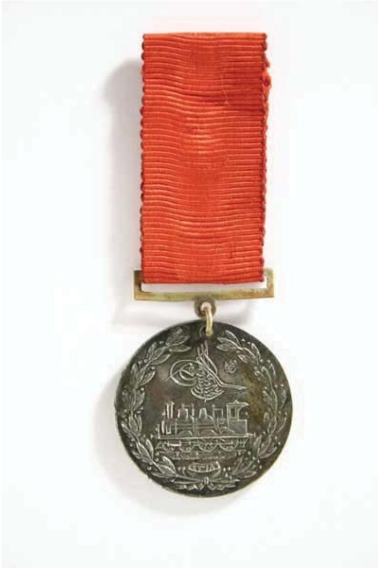
Kırgız manapı Şabdan Han Cantay oğluna Osmanlı Sultanı II. Abdülhamit tarafından verilen altın madalya