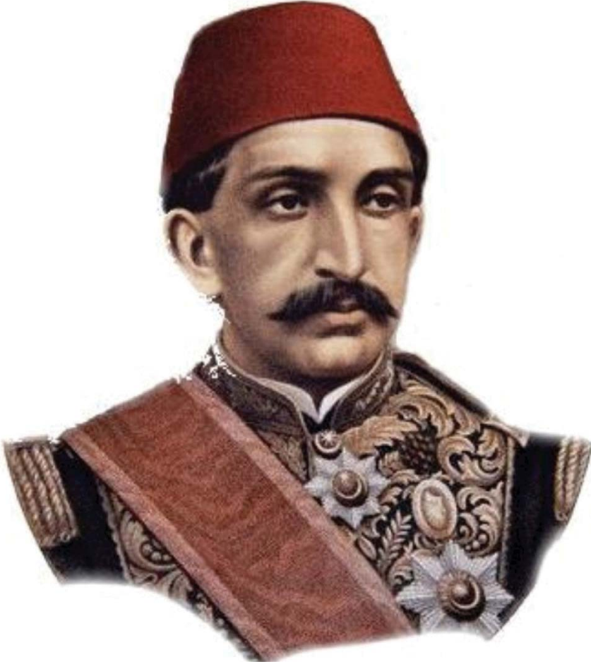
Osmanlı Sultanı II. Abdülhamit (21 Ekim 1842-10 Şubat 1918 – arasında yaşamış, 1876-1909 yılları arasında devleti yönetmiştir.)