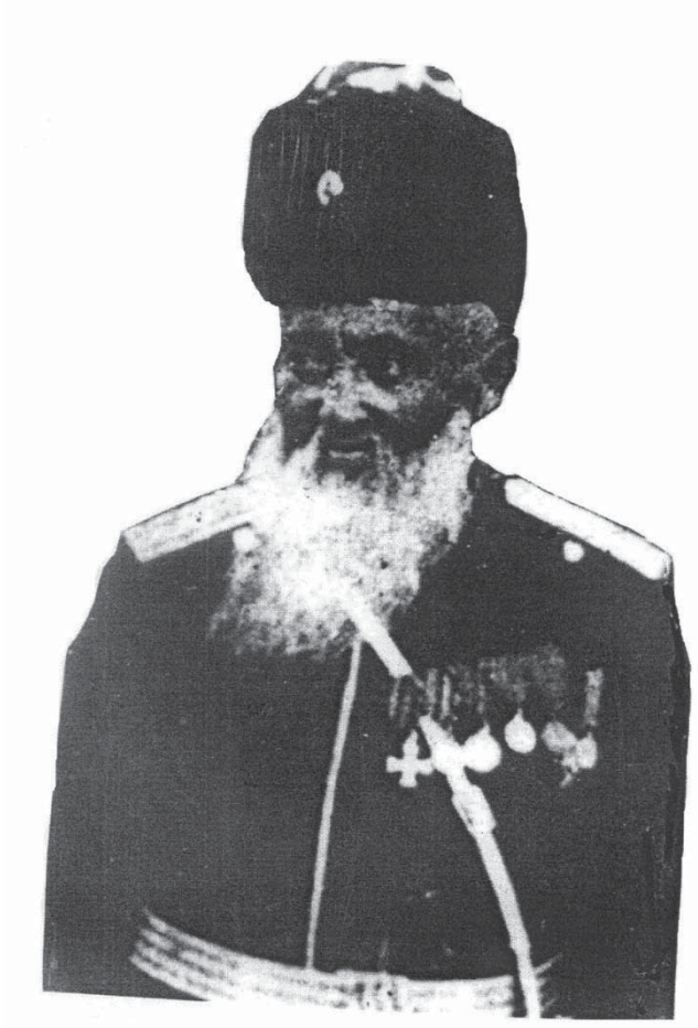
Şabdan Cantay oğlu (1839 - 1912). 1909 y.