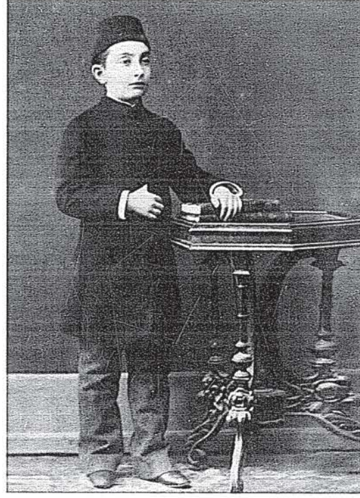
II. Abdülhamid'in çocuklarından Mehmed Selim, Naime ve Ayşe Sultan iyi birer piyanist; Mehmed Abdülkâdir Efendi iyi bir kemânî ve Abdürrahim Efendi de iyi bir viyolonselci olarak tanınmışlardı.

II. Abdülhamid'in kendi ifadelerinden, onun musikiyi sevdiği, iyi nota bildiği, oldukça iyi piyano ve biraz da keman çaldığı, daha çok alafanga musikiyi tercih ettiği ve bilhassa opera ve operetlerden çok hoşlandığı anlaşılmaktadır 6 . Padişahı gençliğinden beri tanıyan, dönemin Paris elçilerinden Salih Münir Çorlu da Padişahın ara sıra piyanoda İtalyan havaları çalarak eğlendiğine şahit olduğunu söylemiştir 7 . Bu konuda P. Dussap şunları anlatıyor: Abdülhamid bazı akşamlar çalgı çaldırıp eğlenirdi. Keman nevinden âletler ile piyanodan mürekkep kuvarteleri pek severdi. Böyle bestelenmiş bir parça çaldıktan sonra benden bir şey teganni etmemi rica eder, sonra mûsiki üzerine mubâhase açardı 8 . Abdülhamid piyano, keman ve viyolonsel gibi kendi sevdiği sazları çalan sanatçılarla yakından ilgilenirdi. Meselâ Muzika-i Hümayun'da I. keman Vondra Bey'i Paris'e göndermiş ve orada uzun süre musiki eğitimi