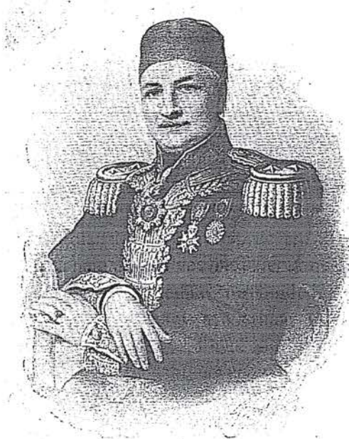
دونیزتی پاشا - موسیقہ عسکر یہ من مؤسی Giuseppe Donizetti Pacha. Organisateur des Musiques Imp. Ottomanes.