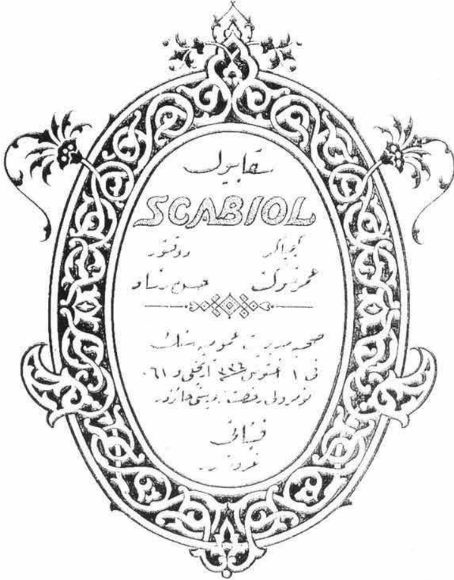
Resim 3 : Hattat Halim tarafından hazırlanan bir ilaç kutusu tasarımı : Scabiol/Skabyol

Hattat Halim'in bir eczane için yaptığı 'Nesih' çalışma (1925 ?). İmza üstte Halim, altta: Hattat Mustafa Halim (Resim 2).