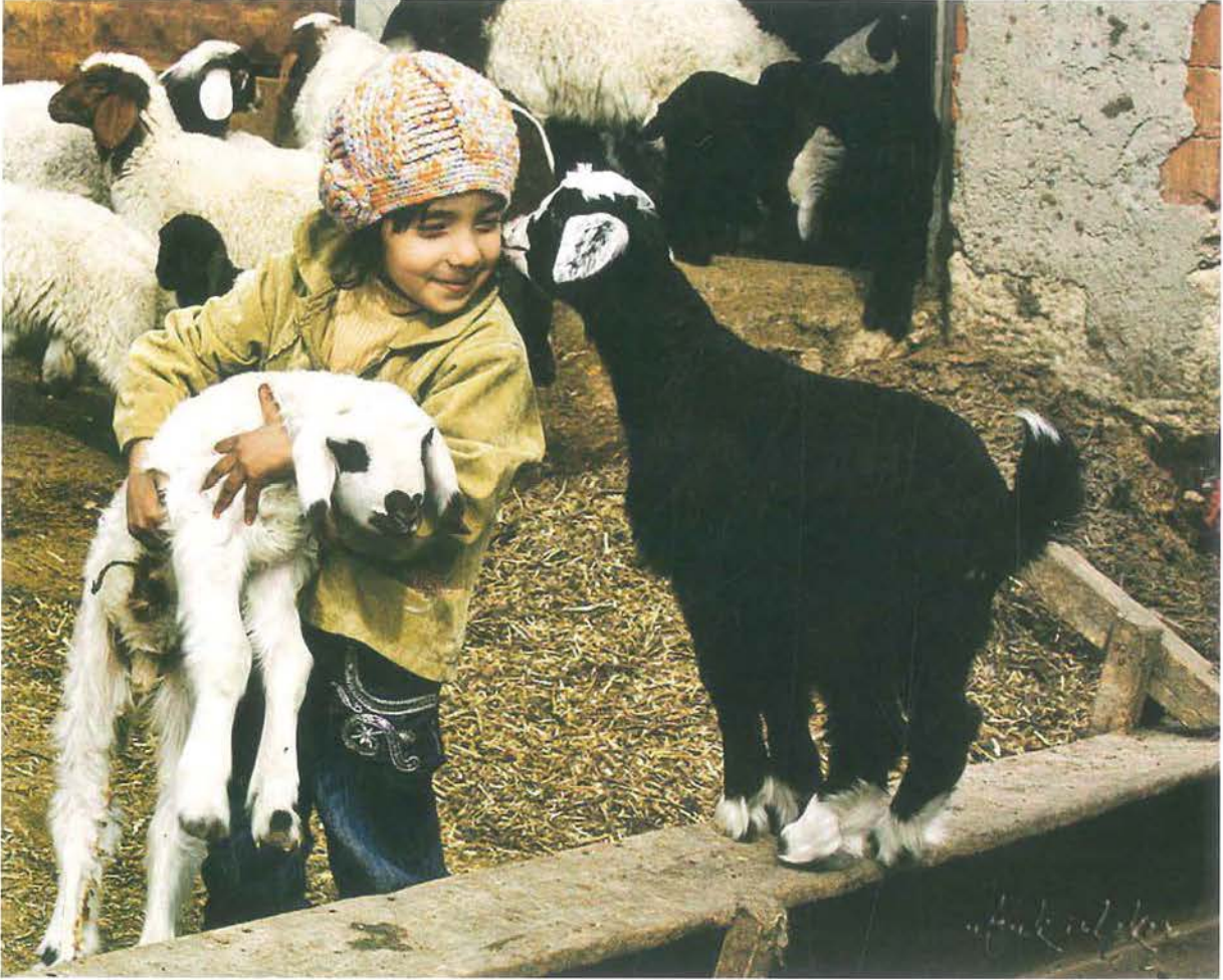
Bir yörük kızı, koyun ve keçi

maktadır. En eski yörük ve en köklü boy anlamına gelen bu kayıt, Karakeçililerin tarihi hakkında bize önemli bilgiler vermektedir. Karakeçililer, Süleyman Şah ile Ertuğrul Gazi idaresinde, Fırat nehrini takip ederek, Rakka üzerinden Anadolu'ya gelmişler, bu göç esnasında yaklaşık 8000 civarında Karakeçili'lerin bir kısmı Urfa yöresine yerleşmiş, kalan diğer bir kısmı da Konya, Bursa, Eskisehir, Bilecik ve Gaziantep'e geçmişlerdir. Bunun yanında Halep ve Arappınar (Mürsitpınar) ile Elazığ'a yerleşenler de olmuştur. (Gülensoy,1994: 2).