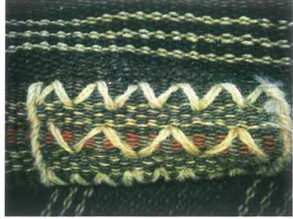
Karaman Kıl Dokuma Çuval ve Kenarların kolan dokumalarla birleştirilmiş görünümü