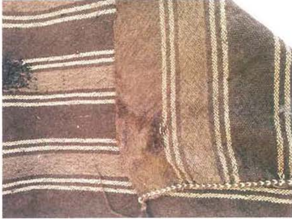
Karaman düz dokuma yaygısı

XI. Yüzyıldan itibaren kendilerine Türkmen de denilen Oğuzlar'ın, Oğuz Türkleri ile İran, Azerbaycan, Irak ve Türkmenistan Türkleri'nin ataları olduğu bilinmektedir. (Sümer, Faruk, s.V) Orta Asya'dan Anadolu'ya yerleşen Sarıkeçililer'in Oğuz boylarından hangisine mensup olduğu belirtilmese de İçel, Aydın, Konya, Karahisâr-ı Sahib, Akşehir ve Saruhan sancakları, Doğanhisarı Kazası (Konya sancağı), Antalya Kazası (Feke Sancağı), Eğridir, İsparta, Burdur, Dazkırı ve Uluborlu kazaları (Hamid sancağı), Tavşanlı, Honoz Kazası (Kütahya sancağı) gibi yöreler onların yaşadığı çevreler idi. Kışları İçel-Silifke-Gülнар-Anamur sahillerinde, yazları da Konya'nın Seydişehir-Beyşehir yaylalarında kira ile yazlamakta olan Sarıkeçili ailesi, bugün (1995'lerde) ancak, 100-200 haneden ibaret olup, konar-göçer hayatı sürdürmekte, yani toprak-sızdırlar (Cevdet,1994:822).