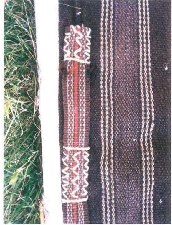
Karaman Kıl Dokuma Torba ve Kenarların kolan dokumalarıyla birleştirilmiş görünümü

larını da keçi kılından yapılan dokumalar içinde anlatabiliriz.