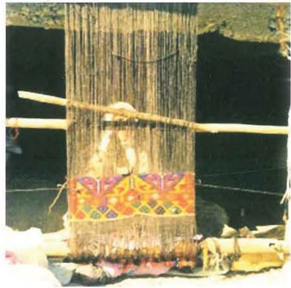
ıstar dokuma tezgahının řematik ve resimsel grnm