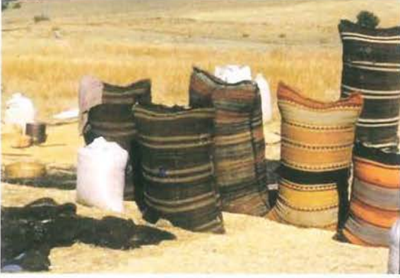
Konar göçerlerin desenli erzak torbaları

3-4 yün ipliğin çözgü ipliklerine ilave edilmesiyle sağlanarak çizgisel bir efekt verilmiştir.