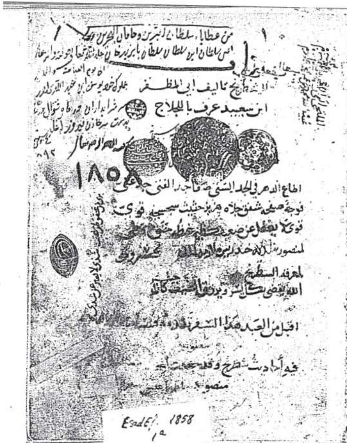
I. Sultan Hamid'in Lala İsmail Ağa'ya hediye ettiği kitabın unvan sayfası.

kiye'de asırlardan beri oynanmaktadır. Fâtih Sultan Mehmed'le Yavuz Sultan Selim, ustalıkla oynarlardı. Padişahlar, nedimleri arasına satranç ve damacıbaşları da alırlardı. Hekimbaşı Emîr Çelebi'nin ölümü de bir satranç oyunu yüzünden olmuştur. IV. Sultan Murad da mâhir bir oyuncu idi. Ekseriya onunla oynardı.