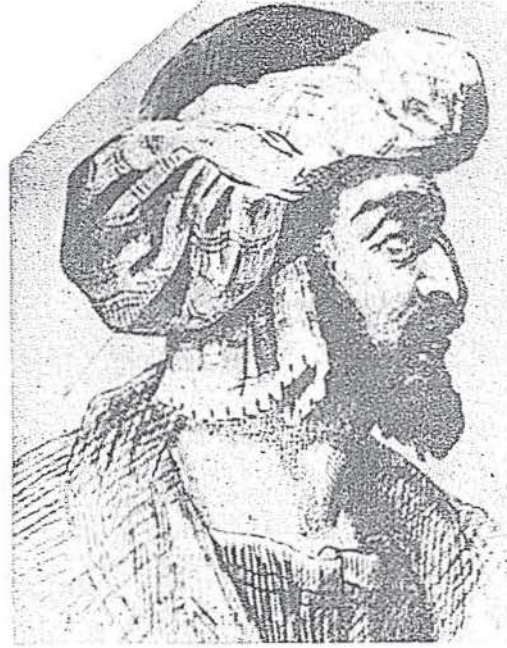
Osmanlı Devleti'nin kurucusu Osman Bey.

H ÂLEN elde mevcut kaynakların verdiği bilgilere göre, Selçuklular Osmanlıların mensup olduğu Kayılara 1231 tarihinde Söğüd'ü yurd olarak vermişlerdir. Aynı yerle, yeni kazanılan toprakların Osman Bey'e mülk olarak verilmesi ise 1284 tarihine rastlar. Kendisine Beylik alâmetlerinin gönderilmesi 1289 tarihinde. Osman Bey, Bizans aleyhine olarak topraklarını genişlettiği sırada 1299 tarihinde Selçuklu Devleti'nin çöküşü üzerine bu devlete tâbi olma durumu son bulmuştur. İşte bu dört tarih, kendi görüşlerine göre birçok tarih yazarları tarafından Osmanlı Devleti'nin başlangıcı veya istiklâli tarihi olarak kabul edilmiştir. Osman Bey, kendisine tâbi olanlar tarafından 1299 ta-