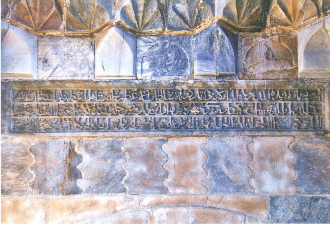
Taş Eserler Müzesi kitabe

uygulamasının, Üstad-ı Mimar Kaluyan el-Konevî tarafından, bazı teknik hataların giderilerek tekrar kullanıldığı bir yapıdır. Medrese, hem ön cephe tasarımında ulaştığı tasarım olgunluğu, hem de özellikle portaldeki yüzeyden taşıntılı, kabarık, ağırlıklı olarak bitkisel karakterli süslemesiyle dikkati çeker. Bu süsleme biçimi, XIII. yüzyılın üçüncü çeyreği ve XIV. yüzyılın ilk yarısına ait Erzurum ve Sivas'taki birçok eserde karşımıza çıkar. Bu anlamda, Sâhib Ata'nın, Kölük bin Abdullah veya Kaluyan el-Konevî gibi mimarlarına, mimari ve süslemede yeni uygulamalarını gerçekleştirebileceği bir serbestlik tanıdığı, ayrıca bilinen şemaların tekrarlandığı