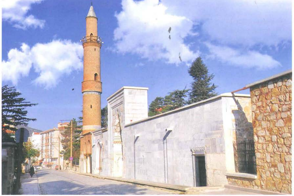
Taş Eserler Müzesi

yaptırdığı Sivas'taki külliyesi, vakfiyesindeki ifadeye göre dış surun güney yöndeki kapılarından birinin karşısındaydı. Bu duruma göre, şehre güney yönden (Kayseri) gelen kervanların ilk göreceği bina, bu medresedir. Ortaçağ Sivas'ının ticaret hayatı, Ulu Cami ve çevresinden, güneye Sâhib Ata (Gök) Medrese ve çevresine yayılmıştı. Bu alanın, XV. yüzyıl belgelerinde " Medrese-i Sâhib Maballesî " ismiyle anılıyor olması, Sâhib Ata külliyesinin burada yeni bir yerleşimin gelişimine sebebiyet verdiğini gösterir.