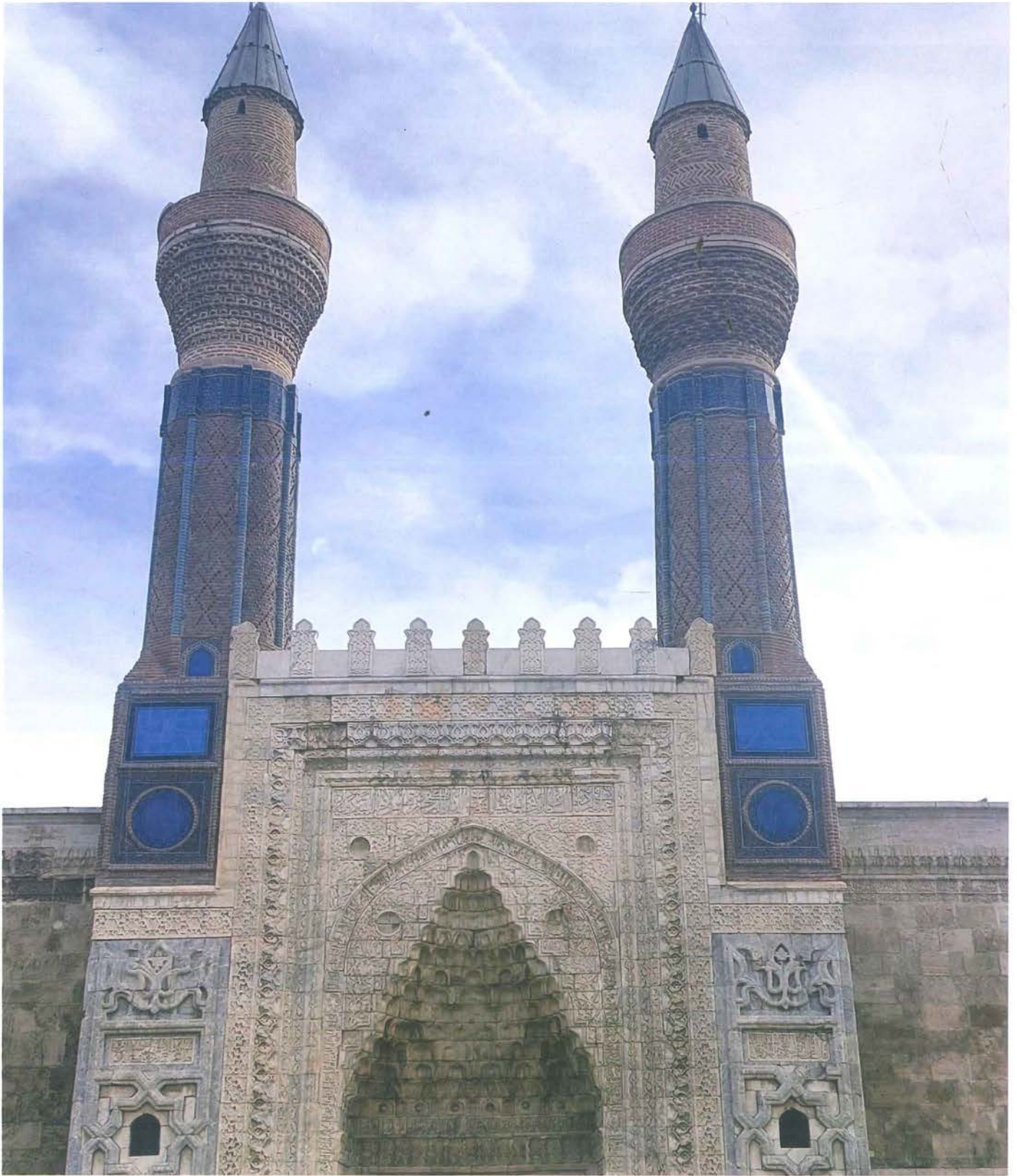
Sivas Gök Medrese