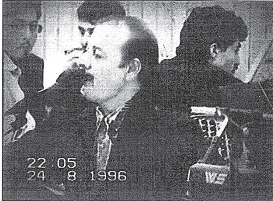
Resim 6. Neşet Ertaş, bir gurbetçi düğününde.