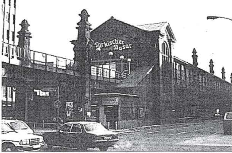
Resim 3. 1980'li yıllarda Türk Çarşısı'nın girişi.