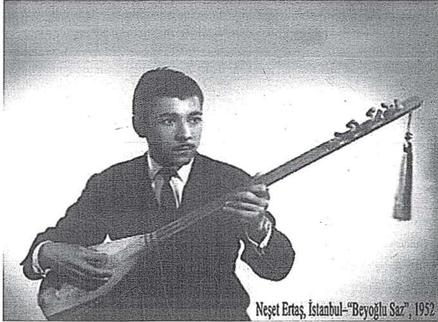
Resim 2. “Beyoğlu Saz” İstanbul, 1952