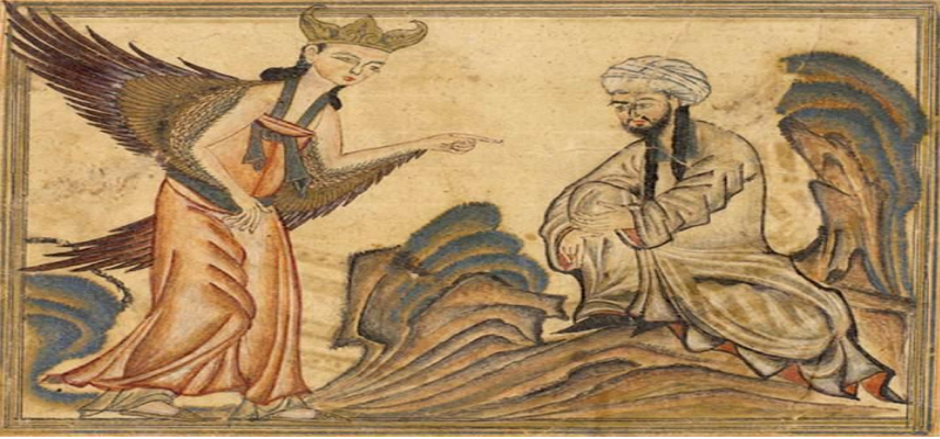
Görsel 8: H. Muhammed'in Cebrail'den aldığı ilk vahiy, Peygamber olması: (kaynak: http://www.zombietime.com/mohammed_image_archive/islamic_mo_full/ adresinden 04.07.2015)