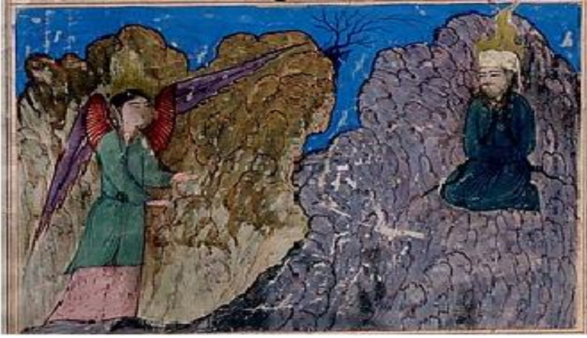
Görsel 13: İlk Vahiy (kaynak: http://www.metmuseum.org/collection/the-collection-online/search/451418 , 04.07.2015)