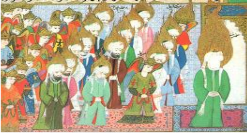
Görsel 19: Hz. Muhammed –yüzü peçeli-, İsra esnasında Mescid-i Aksa'da evvelki peygamberlere ve meleklerle namaz kıldırırken; Siyer-i Nebi, 1595, 3. cild, 6b, New York Public Library, Spencer Koleksiyonu. (kaynak: Tanındı; 1984, 39. minyatür).