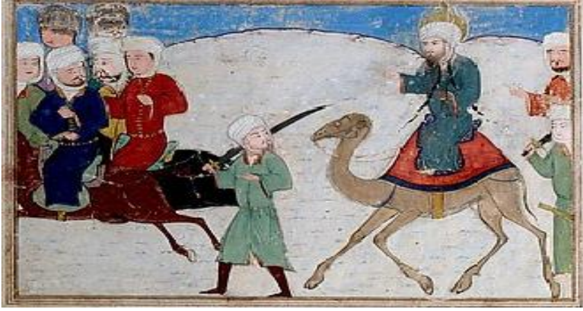
Görsel 14: Hz. Muhammed'in Huneyn gazası (Resmin kaynağında Hz. Muhammed'in seyahati yazıyor: http://www.metmuseum.org/collection/the-collection-online/search/451392 , 04.07.2015)

Hafız-ı Ebru'nun minyatürlerinde Hz. Muhammed'in başının etrafındaki halenin geri geldiğini ve daha sonra çokça görüleceği üzere kutsal bir alev biçimini aldığı görülmektedir. Tipler klasik Uygur tipinden farklı olarak, dolgun yüzlü olmamasına rağmen, gözler çekikliğini korumaktadır.