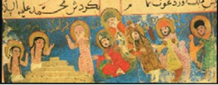
Görsel 4: Hz. Muhammed, Varka ve Gülşah'ı öldükten sonra diriltirken:(kaynak: Tanındı, 1984; 9)

H. Muhammed, el-Hoyi'nin kitabının minyatürlerinde, el-Biruni minyatürlerinde olduğu gibi haleyle çizilmiştir. Hale, Hıristiyan dini resimlerinde kullanılan bir kutsiyet göstergesi olması bakımından ilginçtir. Ayrıca Hz. Muhammed'in ya sarığı, yahut döşeği; İslam kültüründe cennetin rengi olarak bilinen yeşil renk ile betimlenmiştir.