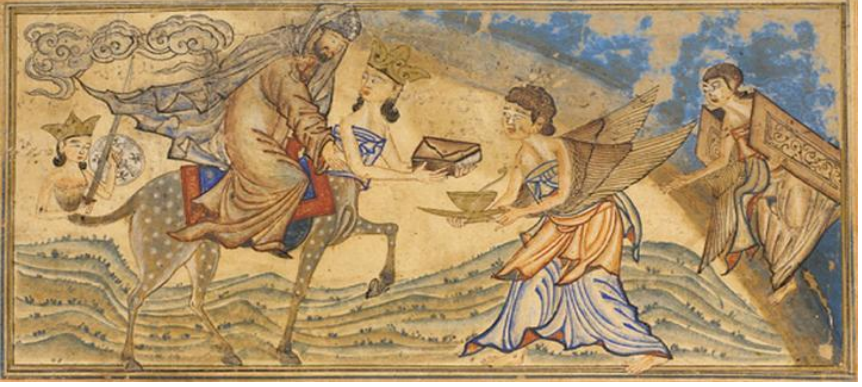
Görsel 9: Mirac; Hz. Muhammed, Burak üzerinde göklerde meleklerle karşılaşırken