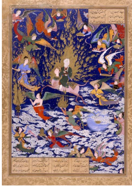
Görsel 18: Nizami'nin Hamse'sinden Miraç sahnesi. Tebriz, İran, 1539-43. Günümüzde, British Library'de (BL Or. MS 2265, f. 195) bulunmaktadır. (kaynak: http://www.bl.uk/onlinegallery/sacredtexts/nizami.html , 07.07.2015).