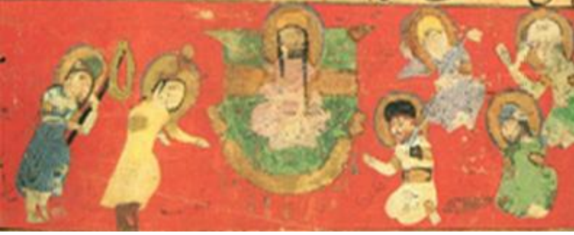
Görsel 3: Hz. Muhammed, dört halifeyle beraber Şam şahını dinlerken: (kaynak: Tanındı, 1984; 9)