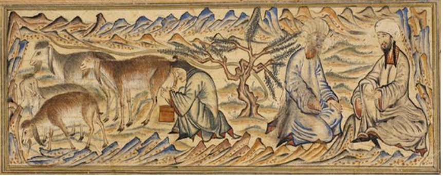
Görsel 10: Hicret; Medine yolunda Kendisi ve Ebubekir'e keçi sürüsünden süt sağan kadın: (kaynak: http://www.zombietime.com/mohammed_image_archive/islamic_mo_full/ adresinden 04.07.2015)