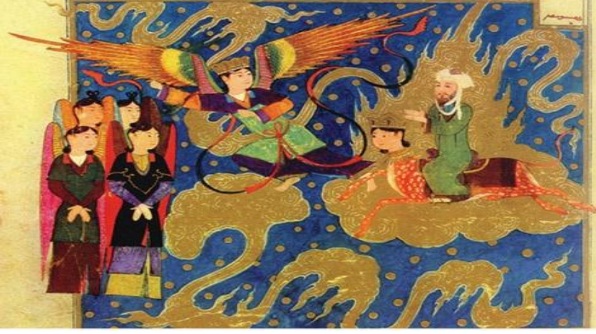
Görsel 16: Hz. Muhammed dördüncü kat göğe girerken (kaynak: Ramezanmahi-Gehi, 2012: 21)

Uygurca yazılan eserdeki tipler, Maniheizt Uygur fresklerinden alınma gibidir. Ayrıca Hz. Muhammed ve diğer peygamberler yanan ateş halindeki halelerle kuşatılırken, Hz. Muhammed'in halesi, diğer peygamberlerinki baş seviyesinde olmasına rağmen, bel seviyesinden itibaren tespit edilmiştir. Melek vücutlarındaki hüsnalık, İslam anlatısıyla uyum içindedir.