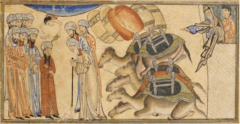
Görsel 6: Hz. Muhammed'in Rahip Bahira ile Karşılaşması