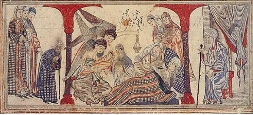
Görsel 5: Hz. Muhammed'in doğumu: (kaynak: http://www.zombietime.com/mohammed_image_archive/islamic_mo_full/ adresinden 04.07.2015)

ve Greko-Budist üslupta resmetmekteydi. Bu tasvirler, Buda'nın av sahneleri, taht hayatı ve mucizelerine dairdi. Nitekim, Fazlullah da Hz. Muhammed'in yaşamını doğumundan vefatına değin resmederken, sanki Mani ve Buda'nın hayatını anlatan fresk ve minyatürleri taklid ediyordu gibiydi.