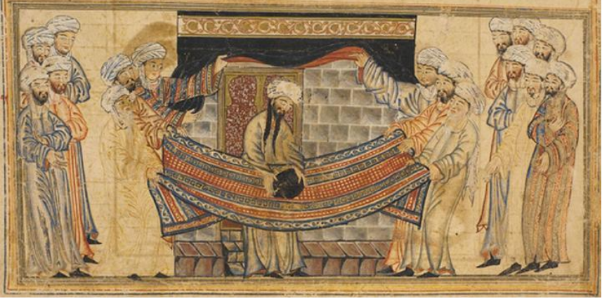
Görsel 7: H. Muhammed'in nübüvetten önce Hacer-i Esved'i yerine koyması