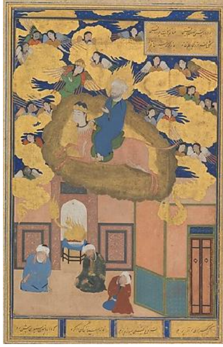
Görsel 17: Hz. Muhammed Miraç'a çıkıyor. Bostan, 16. yy., Buhara yahut Herat