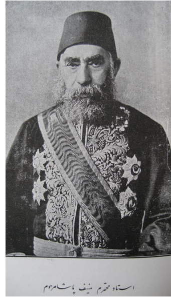
Üstad-ı muhterem Münif Paşa merhum.