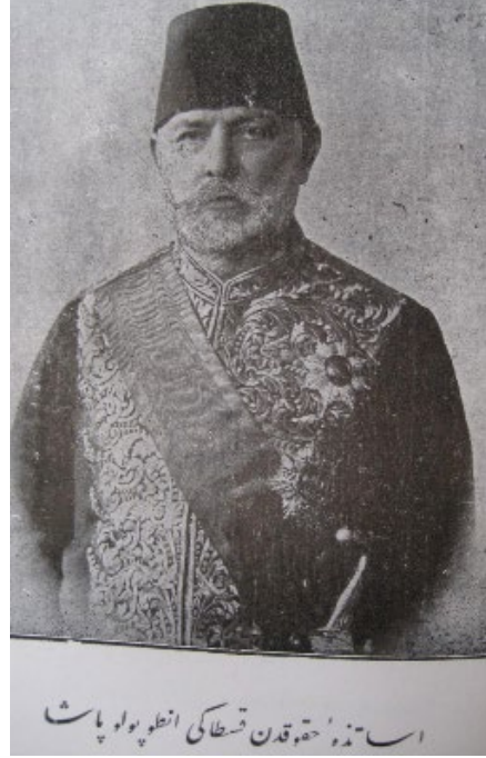
Esâtize-i [Mekteb-i] Hukuk'tan Kostaki Antopulo Paşa.