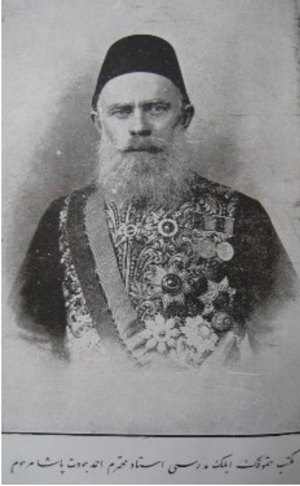
Mekteb-i Hukuk'un ilk müderrisi üstad-ı muhterem Ahmed Cevdet Paşa merhum.