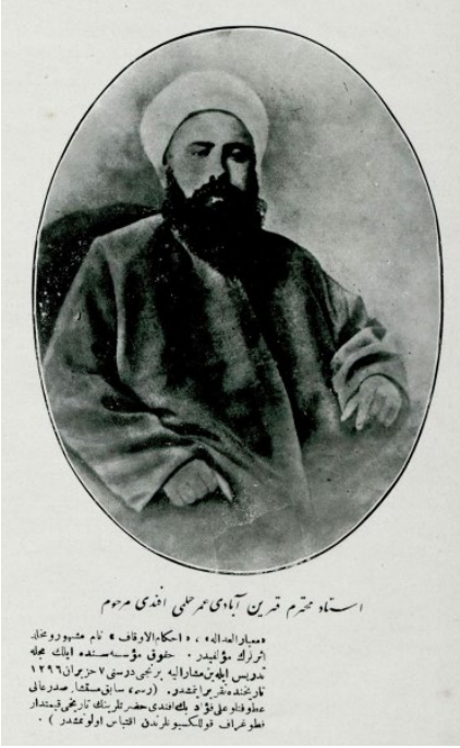
Üstad-ı muhterem Karînâbâdî Ömer Hilmi Efendi merhum. Mi'yârü'l-Adale, Ahkâmü'l-Evkaf nam meşhur ve muhalled eserlerin müellifidir. "Hukuk Müessesesi"nde ilk Mecelle tedris eyleyen müşârünileyh, birinci dersini 7 Haziran 1296 [19 Haziran 1880] tarihinde takrir etmiştir.