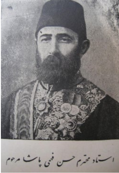
Üstad-ı muhterem Hasan Fehmi Paşa merhum.