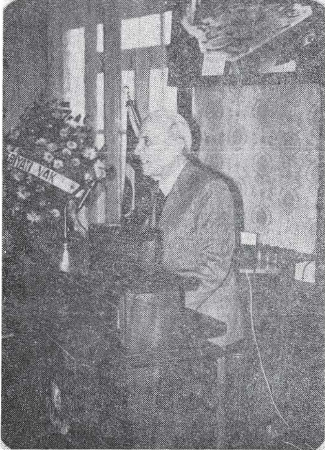
(Prof. Dr. Kafesoğlu kendisine verilen "Boğaziçi Büyük Kültür Ödülü" töreninde konuşurken, 1984)