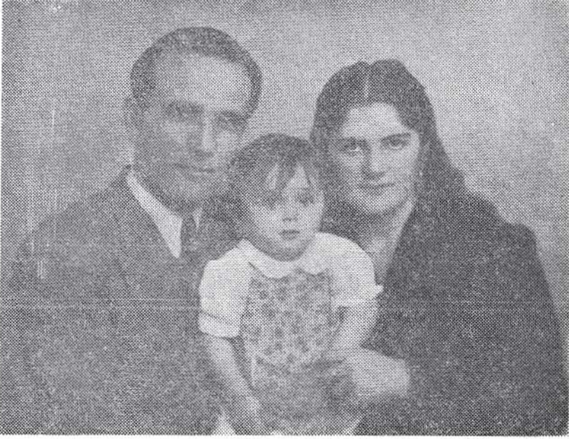
(Hanımı ve ilk çocukları)