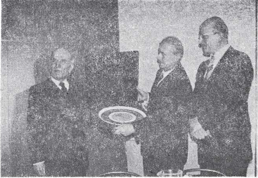
(Türkiye Milli Kültür Vakfı "Kültür Şeref Armađanı" töreninde, 1984)