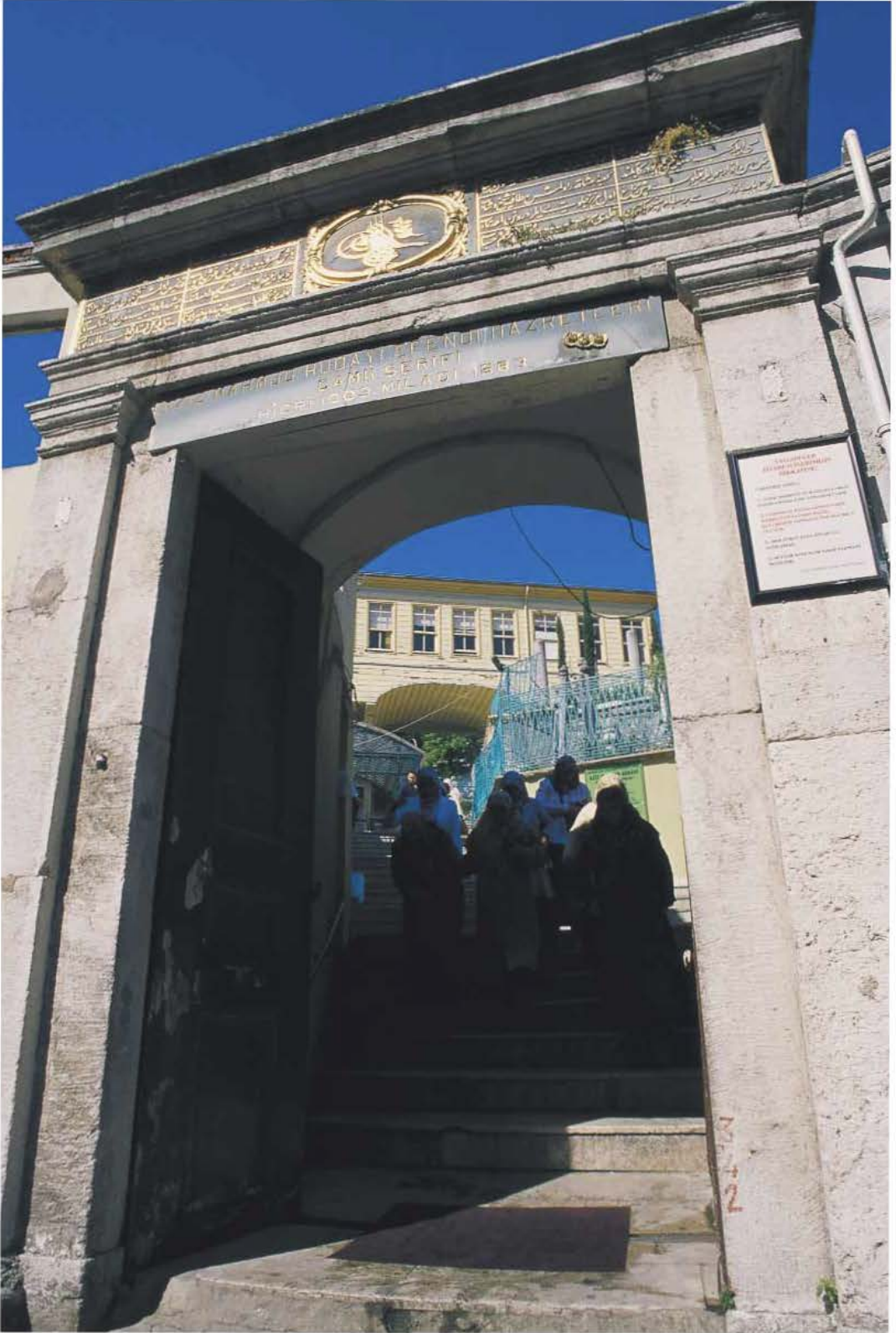
Aziz Mahmud Hüdayi Külliyesi cümle kapısı