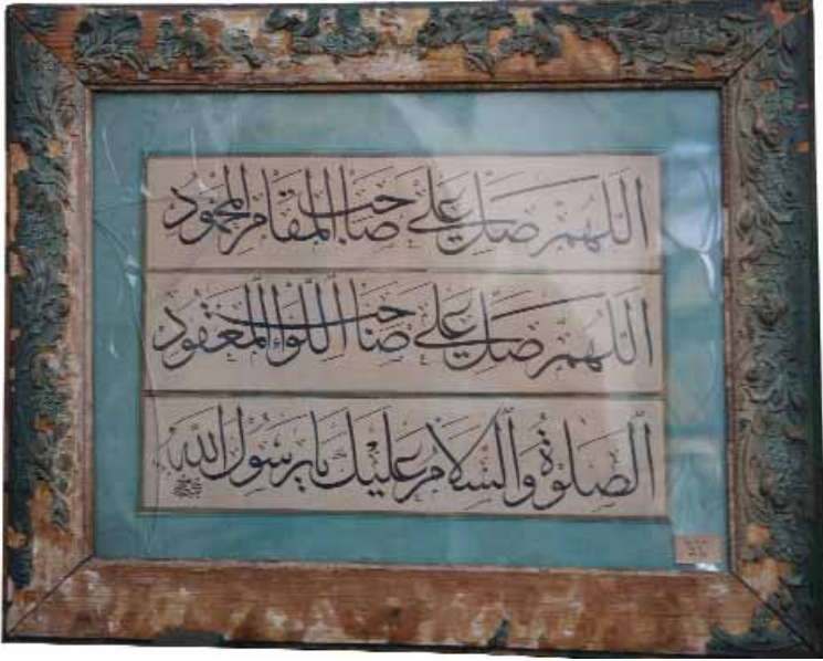
Aziz Mahmud Hüdâyi Türbesinde bulunan bir hat Levhası

Oturur taşra yollarda şeyatın Olur, pes orta yolda ismet-i din