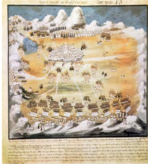
Picture 1: The engraving showing the positions of the Greek rebels and European volunteers during the siege of Tripolitsa

People in Tripolitsa seriously experienced lack of food because no support was provided for the city for three months. As a last resort, a military operation was planned for breaking the siege. To do that, the Ottoman Army prepared additional troops under the command of Bayram Pasha and they set off for Tripolitsa. However, the numerous Greek rebels defeated the troops under the command of Bayram Pasha and they had to withdraw (September 7, 1821). In the meantime, the Greeks attempted certain acts to break the resistance in the city. For instance, the Greeks secretly communicated with some Muslims from Badra who sought refuge in Tripolitsa. Even some of the Muslims of Badra were deceived with the promise of going back to their homeland. Some Muslims believing in this promise left the fortress; however, the rebels massacred all of them. 34