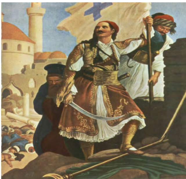
Painting 1: By Peter von Hess . Panagiotis Kefalas Raises the Flag of Freedom on the Walls of Tripolitsa (In the background of the painting, the ruins of the mosque and the bodies of the brutally killed Turks on the ground are visible.) (Source: Peker, ibid , p. 197)

those who personally witnessed the massacre. When the matter is considered from this perspective, and as Maurice Persat, who witnessed the events, and the Turkish researchers determined, there is no doubt that in Tripolitsa, the Greeks brutally killed 40 thousand Turks and Jews. 67