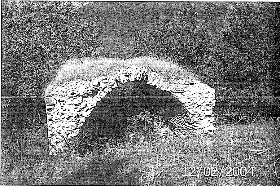
Daniřmendli Dönemi Amasya Fatih İltekin Gazi'nin harap edilmiř Türbesi (Dış görünüşü) H. 499/500 - 1106 M.