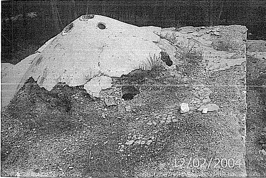
Danişmendli Dönemi Amasya İltekin Gazi Köyü Tarihi Hamamı (dış görünüşü) (H. 466/467 /1074 M.)