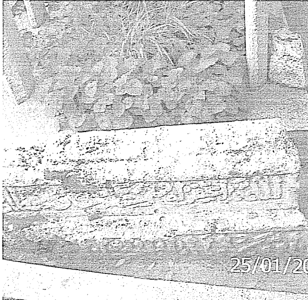
Danişmendli Dönemi Amasya Sarıhan Camii önündeki Danişmendli mezartaşının kırılmış durumu