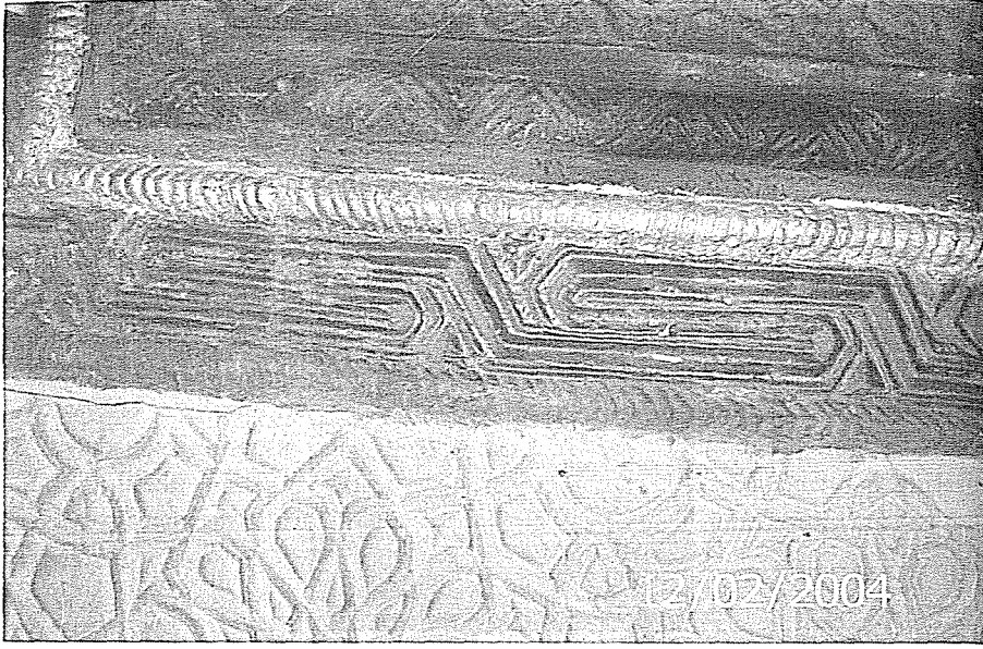
Amasya Danişmendliler Dönemi İltekin Gazi Kale Köyü Câmii'nin Danişmendli dönemi damgaları