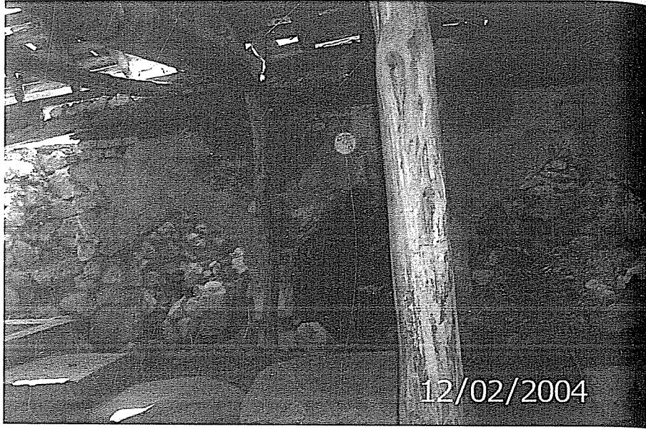
Daniřmendli Dönemi Amasya İltekin Gazi Köyü Tarihi Hamamı (İç görünüşü)