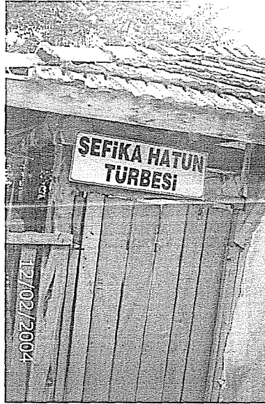
Danişmendli Dönemi Amasya Kale Köyü İltekin Gazi'nin annesi Şefika Hatun'un Türbesi (Dış Görünüşü)