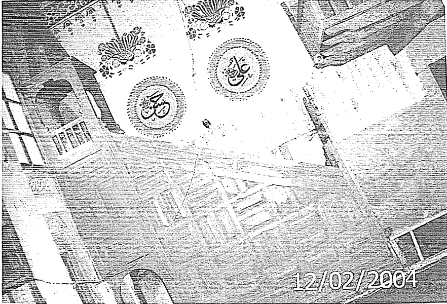
Daniřmendliler Dönemi Amasya Kale Köyü'ndeki caminin mihrabı