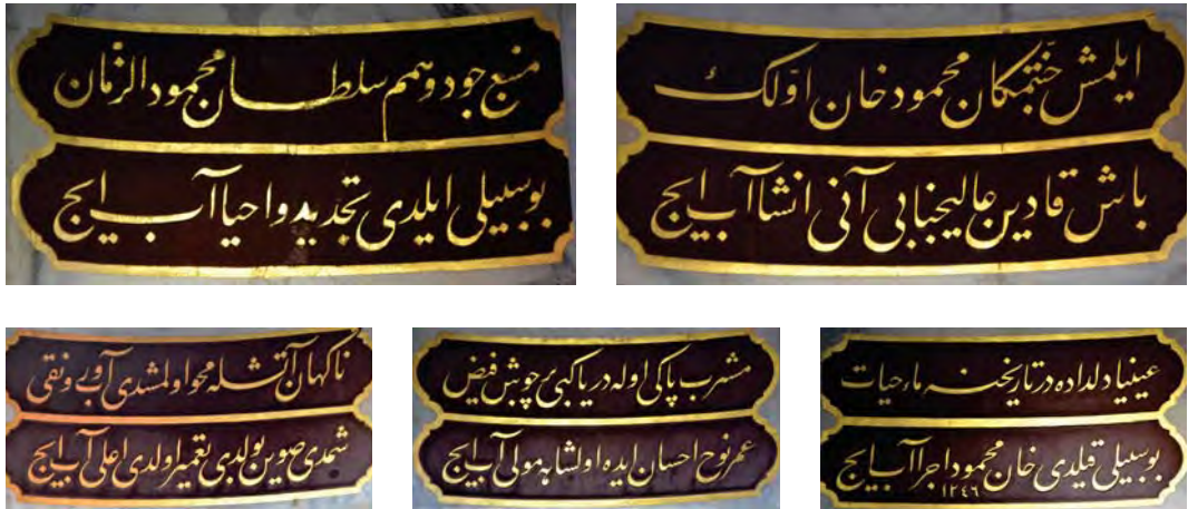
Resim 15: Başkadın Sebili.

Menba'-ı cûd u himem Sultân Mahmûdü'z-zamân Bu sebîli eyledi tecdîd ü ihyâ âb iç Eylemiş cennet-mekân Mahmûd Hân-ı Evvel'in Baş kadın âlî-cenâbı 35 ânı inşâ âb iç Nâgehân âteşle mahv olmuşdu âb u revnakı Şimdi suyun buldu ta'mîr oldu a'lâ âb iç Meşreb-i pâki ola deryâ gibi pür-cûş-ı feyz Ömr-i Nûh ihsân ide ol şâha Mevlâ âb iç Ayniyâ dil-dâdedir târîhine mâ'-i hayât Bu sebîli kıldı Hân Mahmûd icrâ âb iç | 1246