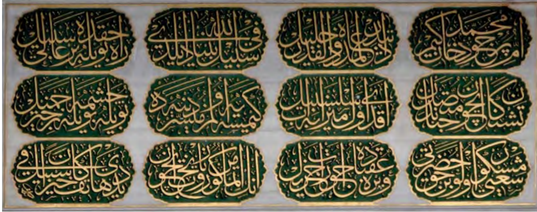
Resim 2: Hatice Turhan Sultan Sebili.

Ânın itmâmın görüp târîh için Dedi hâtîf kâne hayren fî-sebîl | 1074 | Ketebehu Sâmî