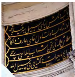
Resim 9: Hacı Beşir Ağa Sebili.

Hidiv-i dâd-meşreb âb-rûy-ı saltanat ya'nî Cenâb-ı Hazret-i Sultân Mahmûd-ı felek-dergâh