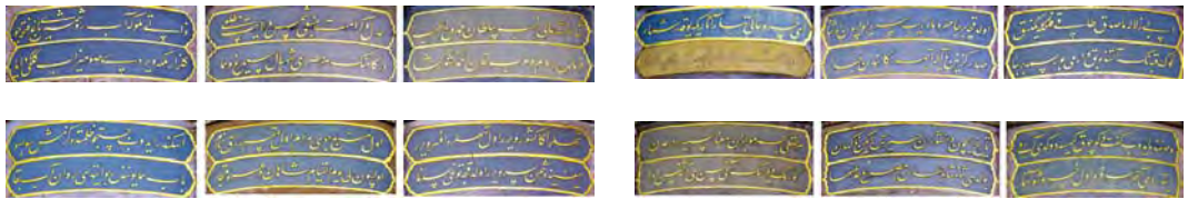
Resim 7: Sultan III. Ahmed Çeşmesi'nin sebilleri üzerindeki kitabeler.

Her lafzı bahr-i mevc-zen ma'nâsıdır dürr-i aden Görmek dilersen ânı sen ey teşne-i hüsni-edâ