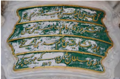
Resim 10: Nuruosmaniye Sebili.