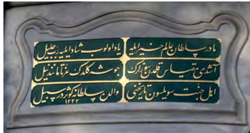
Resim 14: Nakşidil Valide Sultan Sebili.