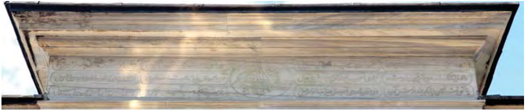
Resim 17: Sultan II. Mahmud Sebili.

Cevher-i târîhime su verdi Zîver feyz-i cûd Buldu kevser rûh-ı Hân Mahmud için zîbâ sebîl | 1256