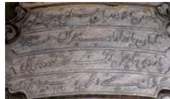
Resim 12: Sultan I. Abdülhamid Sebili.