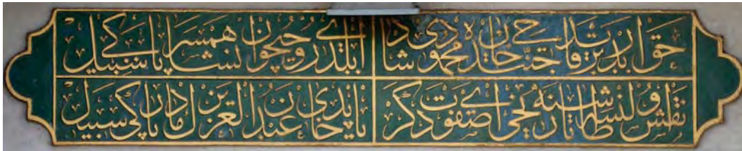
Resim 18: Pertevniyal Valide Sultan Sebili.