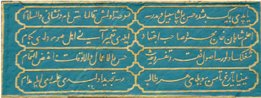
Resim 16: Hadım Hasan Paşa Medresesi ve Sebili'nin müşterek kitabesi.

Yapdı bin beşte Hasan Paşa sebîl ü medrese Suhte olmuş kalmamış nâm ü nişânı ve's-selâm A'lem-i şâhân Han Mahmûd-ı sâhib-ictihâd Eyledi ta'mîr ânı ehl-i ulûm oldu be-kâm Şuglün olursa usûl-ı fikh ü tefsîr ü hadîs Ahsenü'l-a'mâl ve'l-evkât bi'l-feyz-i temâm Ayniyâ târîh-i tâmîn söyledim her tâlibe Medrese tecdîd olundu ilme sa'y eyle müdâm | 1247