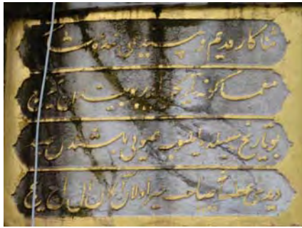
Resim 11: Recai Efendi Sebili.