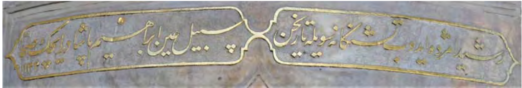
Resim 5: Nevşehirli Damat İbrahim Paşa Sebili'nin manzum kitabelerinin son beyitleri.