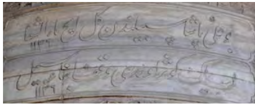
Resim 8: Hekimoğlu Ali Paşa Sebili.