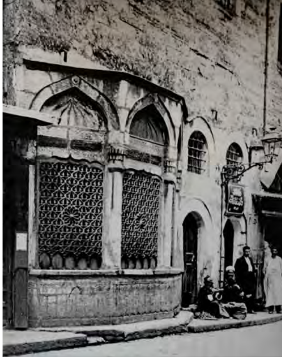
Resim 3: Gülnuş Emetullah Valide Sultan Sebili.

Sebil Beyazıt'ta bugünkü Ordu Caddesi üzerindeki Hasan Paşa Hanı'na bitişik durumdaydı. Yapı 1956-1957 yılındaki yol genişletmeleri sırasında mektep binasıyla birlikte yıkılmıştır. Bu sebilin bugün daha doğuda Simkeşhane bloklarının bir cephesinde replikası bulunmaktadır. IRCICA Arşivi'ndeki eski fotoğrafta sebil yapısının sütunlarla üç bölüme ayrıldığı görülmektedir. Bu fotoğrafta yapının üzerinde kitabelerin olduğu da göze çarpmaktadır (Res. 3). Kitabede Sultan III. Ahmed'in annesi Gülnuş Emetullah Valide Sultan'ın kendisine temlik edilen Simkeşhane'yi genişletip 8 bir mektep ve sebil yapmasıyla ilgili Dürrî Ahmed Efendi'nin bir tarih manzumesi bulunmaktadır. 9 Bu manzumenin Durmuşzâde Ahmed'in hattı olduğu kayıtlıdır. 10 Manzume şudur: