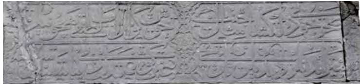
Resim 1: Sultanahmet Arasta Sebili.