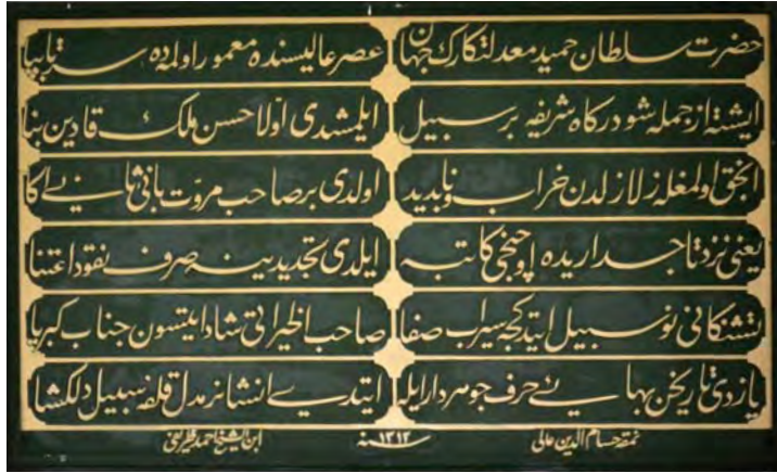
Resim 20: Nermidil Kalfa Sebili.