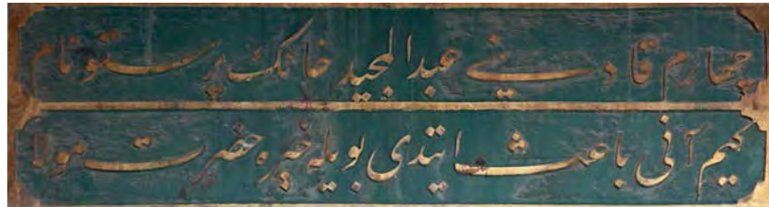
Resim 19: Bâlâ Süleyman Ağa Sebili.