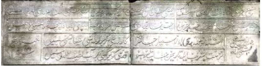
Resim 13: Ragıp Paşa Sebili.

Ta’mîr târîhi sene 1196 | ed-dâ’i Kaşıkçızâde Hüseyin