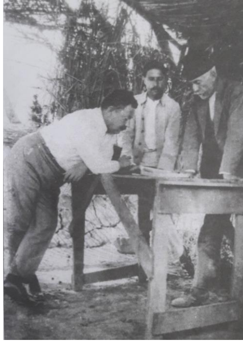
Mustafa Şahyar Bey 32

kuvvetler, Alaşehir'den yapılan bir tören sonrası tekbirlerle ve dualarla gönderilmiştir. 31