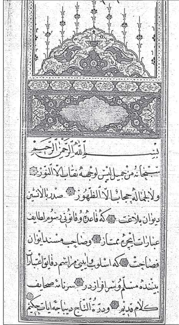
Fatih Sultan Mehmet'in vakfiyesi

13. yüzyılda, Selçuklular'ın Anadolu'daki akademik sanat merkezi Konya'dır. Yüzyılın başlarında yapılan "Varka ve Gülşah" adlı, bir aşk hikâyesini konu alan minyatürlü eser, bu dönemin önemli eserlerinden biridir.