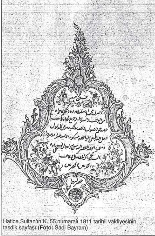
Hatice Sultan'ın K. 55 numaralı 1811 tarihli vakfiyesinin tasdik sayfası

Minyatür sanatında olduğu gibi Orta Asya'dan gelen bu sanat, Selçuklular'ın başkenti Konya'da gelişmeye başladı. Burada Abdullah oğlu Muslih adlı bir tezhip ustası Mevlâna'nın 1278 tarihli Mesnevisi'ni tezhiplemiş, bu eserde süslemenin en güzel örneğini vermiştir. 14. yüzyılda yine Kon-