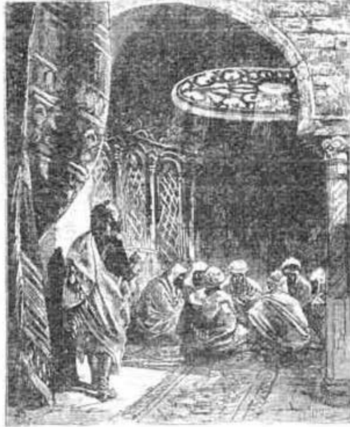
Hâdisenin vukubulduğu devirde Cezayirîlilerin bir toplantısı

nın 4, 5, 6 ve 7 nci maddelerine göre, 1810 yılında Cezayir konsoloshanesinden alınan paralarla, 20 ocak 1793 de ilân olunan harb sonuunda Afrika İmtiyazlı Ticaret Şirketinin zararları da bu paradan mahsubedilecekti. Cezayir'de harb dolayısıyla zarar görmüş pek çok Fransız ticaret müessesesi mevcudolduğu halde onlar kaale alınmıyarak yalnız Afrika şirketinin alacağının anlaşmaya ithal olunması şüpheyi calipti. Lâkin, anlaşmanın metninde bu cihet hukukî tâbirler ve dolambaçlı ifadelerle gizlenmişti. Dayı ise, bu alacakların pek küçük bir vekûn tuttu-