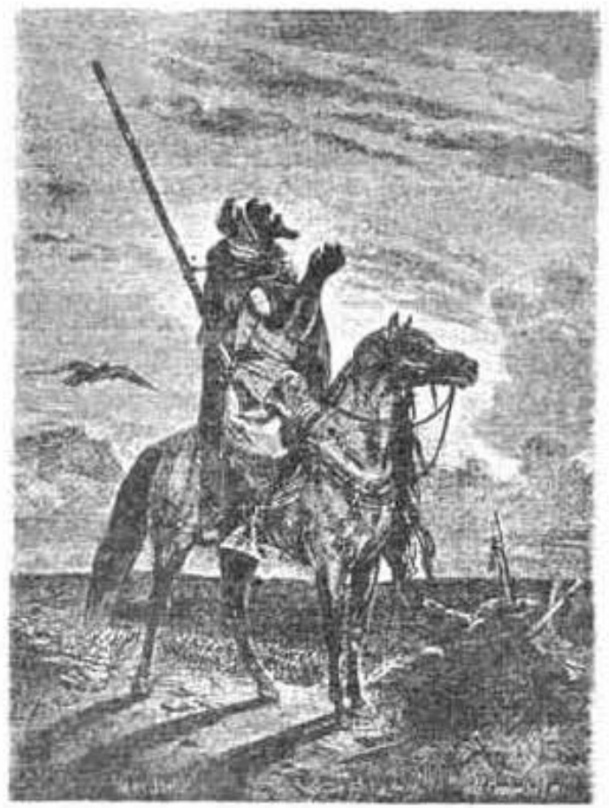
On dokuzuncu Asırda bir Cezayir süvarisi