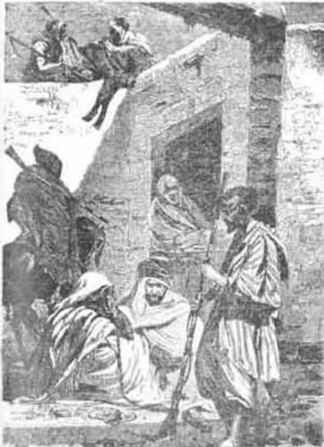
On dokuzuncu Asırda Cezayirli muharipler