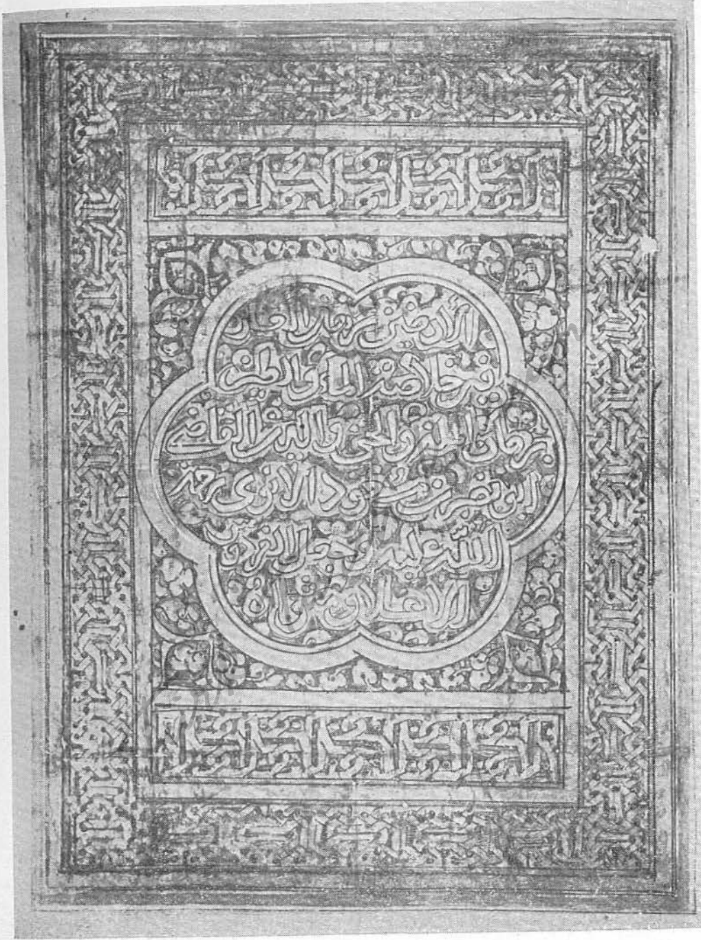
Resim 3 — Anis al-Ḳulûb . Kitab ve müellif ismi yazılı tezhipli sayfa (2)