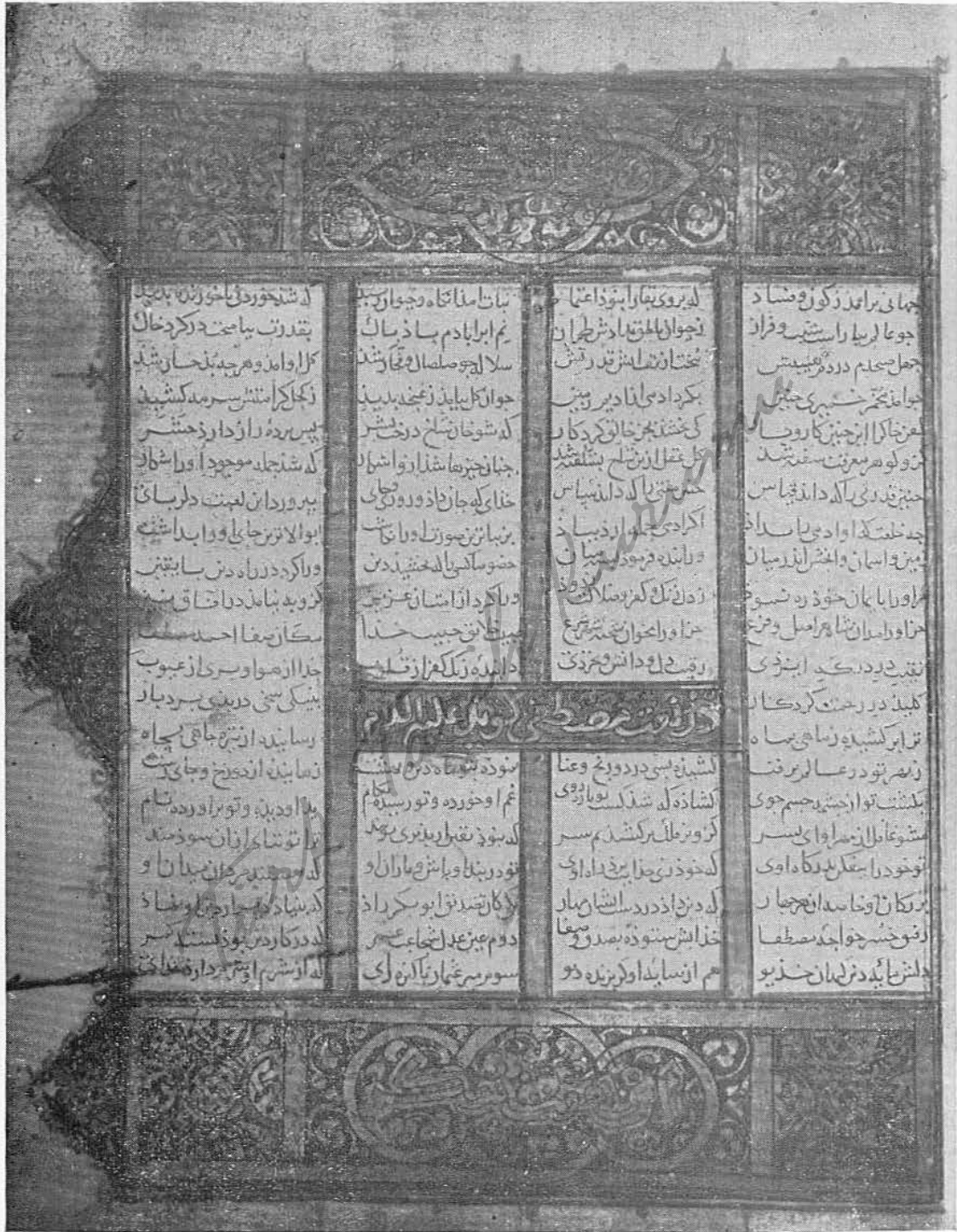
Resim 5 — Anis al-Qulub . Asıl eserin başladığı tezhipli sayfanın karşılığı