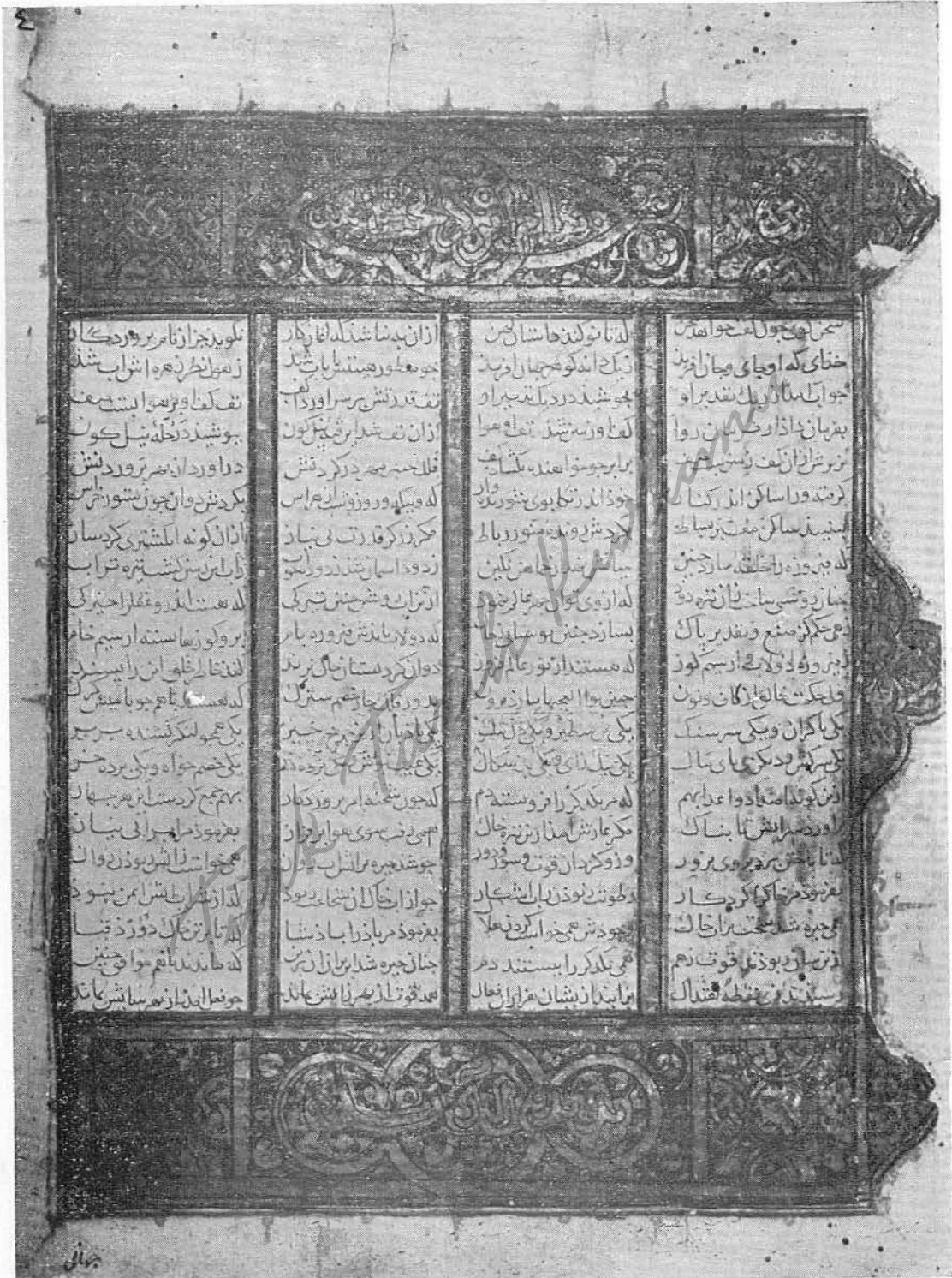
Resim 4 — Anis al-Ḳulūb. Asıl eserin başladığı tezhipli ilk sayfa