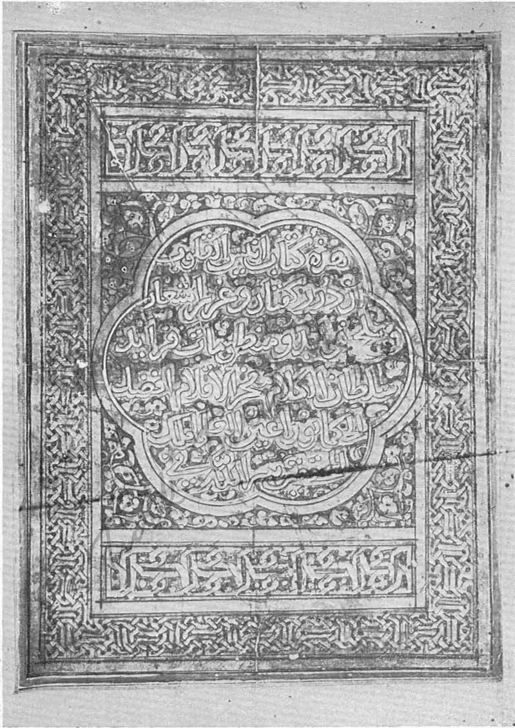
Resim 2 — Anis al-Ḳulûb . Kitab ve müellif ismi yazılı tezhipli sayfa (1)