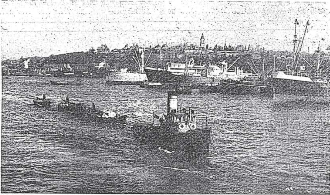
İstanbul limanı Le port d'Istanbul

Tepebaşı, Meşrutiyet Caddesi, No. 157 (Moralı Pasaj, Sol kısım No. 2) Beyoğlu-İstanbul Telefon : 43166