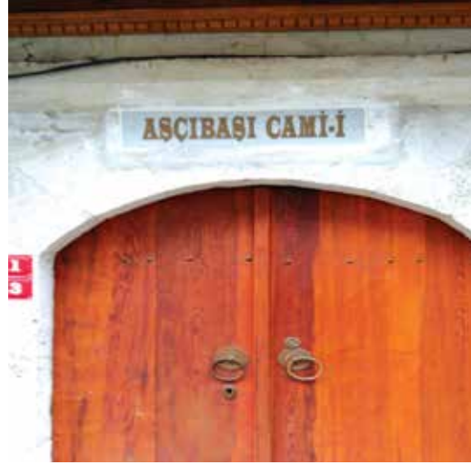
Fotoğraf 13. İki i harfinin arasındaki tire, ayın harfi olarak düşünülmüş olmalıdır

Câmi adlarının bir kısmında, câmiye adını vermiş ya da adı verilmiş kişinin lakabı da yer almaktadır. TDK Yazım Kılavuzu'na göre, kişi adları ve unvanlarından oluşmuş mahalle, meydan, köy vb. yer ve kuruluş adlarında unvan kelimesi sonunda ise gelenekleşmiş olarak bitişik yazılır. Ancak câmi adlarında bu kurala da pek riayet edilmediği görülmüştür.