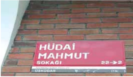
Fotoğraf 18. Sokak adı Hüdai, hemen altındaki mahalle adı Hüdaiyi şeklinde yazılmıştır. Yani aynı tabelada bile bir imlâ birliğinden söz etmek mümkün değildir. Ayrıca, Mahmud yerine ise Mahmud yazılmıştır