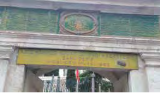
Fotoğraf 14. Burada da iki i arasında bir nokta göze çarpmaktadır. Ayrıca Aziz Mahmud Hüdâi'nin adı da bazen Hüdâi, bazen Hüdâi şeklinde yazılmıştır