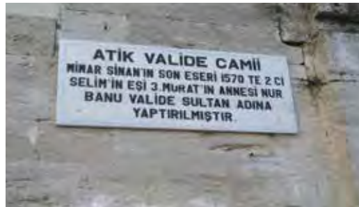
Fotoğraf 32. Üsküdar'ın en güzel tarihî câmilerinden biri olan Atik Valide Câmii'ne hiç yakışmayan bir tabela. Üstelik bu kısa künyede en az iki yazım yanlışı vardır