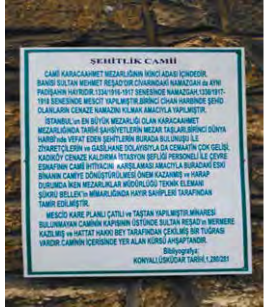
Fotoğraf 7. Câminin künyesi hakkında bilgilerin yer aldığı bu tabelada birden fazla yazım yanlış olduğu görülmektedir

Üstelik bu imlâ sorunu sadece câmilerle de sınırlı değildir. Okullarda, üniversitelerde, basın-yayın araçlarında, sosyal medyada, internet sitelerinde velhasıl pek çok yerde bu yazım yanlışıyla karşılaşmak mümkündür.