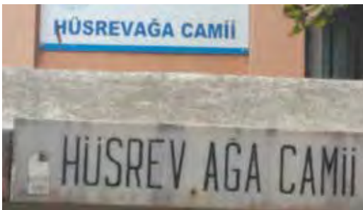
Fotoğraf 24. TDK Yazım Kılavuzuna göre, müftülük doğrusunu yazmıştır