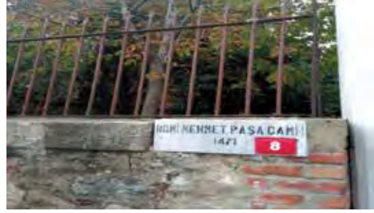
Fotoğraf 47-48-49. Tabelalar hem eski hem de kolayca görülebilecek yerde değiller