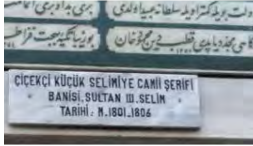
Fotoğraf 41. Çiçekçi Küçük Selimiye Câmii Şerifi yazılışı Türkçe dil bilgisi kurallarına uymamaktadır