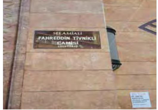
Fotoğraf 11. Tamamen yıkılıp yeniden inşa edilen Câmi, 2016'da ibadete açılmıştır

Daha önce câmi kelimesinin etimolojisinden bahsederken kelimenin Arapça asıllı olduğunu, çeviri-yazı ile câmi' şeklinde yazıldığını, sondaki ' işaretin Arapça ayın (ع) harfini karşıladığını söylenmişti. Arapçada ayın harfi bir ünsüzdür. Dolayısıyla câmi' kelimesinden sonra iyelik üçüncü şahıs eki getirildiğinde, yukarıdaki örneklerde olduğu gibi ünsüzle biten kelimelere getirilen "i" iyelik eki yazılmalıdır. Çünkü câmi kelimesinin son harfi bir ünsüzdür: Gülfem Hatun Câmi'i, Mihrimâh Sultân Câmi'i vb. Fakat Türklerin hançeresinde böyle bir ünsüz ve tabii olarak onu karşılayan böyle işaret bulunmadığından birer belirtisiz ad tamlaması olan câmi adları da bu harf yok hükmünde sayılarak iki i ile yazıla gelmiştir.