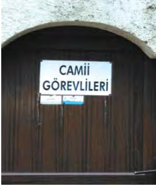
Fotoğraf 8. Üsküdar'ın en görkemli tarihi Câmii olan Selimiye Câmii'nden