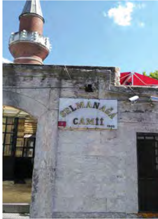
Fotoğraf 27. Bu câminin adı dil bilgisi kurallarına uygun yazılmıştır; ama bu tabelada bilgiler oldukça eski ve özensizdir