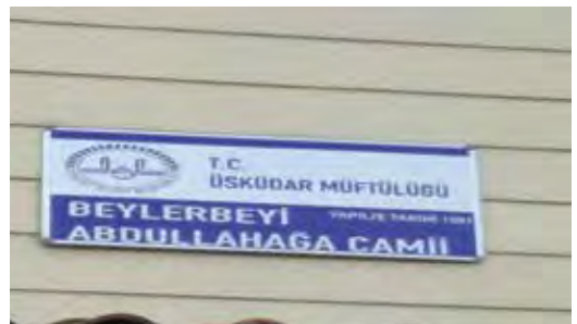
Fotoğraf 25. Aynı câminin adı aynı yerde iki farklı şekilde yazılmıştır