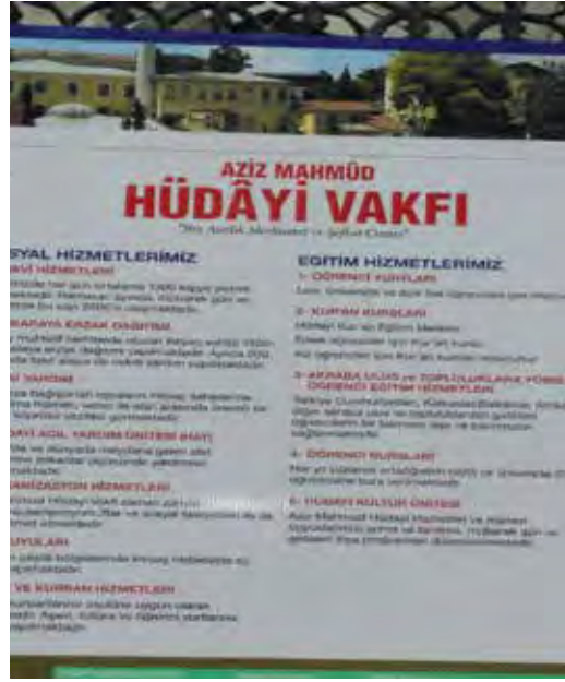
Fotoğraf 17. Bu tabelada da hem ad farklı yazılmış hem de başka dil bilgisel hatalar yapılmıştır

torluğun egemenliği altındaki kimselere ilişkin. Tanımlardan da anlaşılacağı gibi Rûmî, Bizans egemenliği altındaki kimselere ilişkin şeyler için kullanılabilir, bir de Anadolu lu anlamında kullanılabilir; başka bir deyişle bir yere mensup kişiler için bir sıfat olabilir: Mevlânâ Celâleddin-i Rûmî, Bursevî, Konevî, Üsküdarî vb. Rum kelimesi bir yeri değil bir halkı, bir milliyeti temsil etmektedir. Dolayısıyla Türkî, Almanî, Fransızî vs. diyemeyeceğimiz gibi aslı Rum olan birine de Rûmî diyemeyiz.