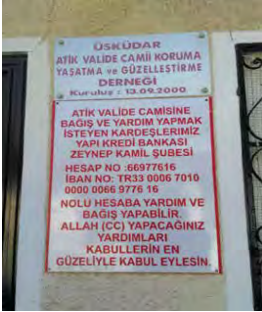
Fotoğraf 12. Yukarıda Atik Valide Câmii, alttaki tabelada Atik Valide Câmisi yazmaktadır