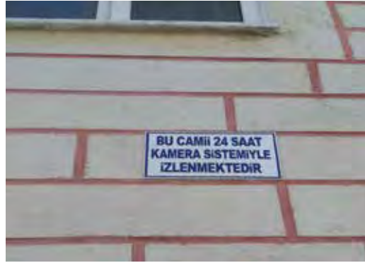
Fotoğraf 5. "Bu" işaret sıfatından sonra kelimenin yalın hâli yazılmalıdır

kündür. Biz bu çalışmada, câmileri iki ana grupta değerlendirme yolunu seçtik: Bilinen ilk câmiden başlayarak cumhuriyete kadar olan câmiler ve cumhuriyetin ilanından günümüze kadar inşa edilen câmiler. Bunu yapmamızdaki asıl gaye, Osmanlı Türkçesi döneminin dili ile temeli 1908 meşrutiyetinden sonra atılan, yenileşme ve özleşme hareketlerini de bünyesinde taşıyan Türkiye Türkçesi arasındaki gerek kelime hazinesi gerekse imlâ bakımından farklılıkları göz önünde bulundurmak suretiyle câmi adlarının yazılışına bakmaktır. Örneğin, geleneksel imlâda Arapça ve Farsça terkiplerin yazılışı ile bugünkü yazılışları arasında Türk Dil Kurumunun kılavuzuna göre kayda değer farklılıklar mevcuttur. 28