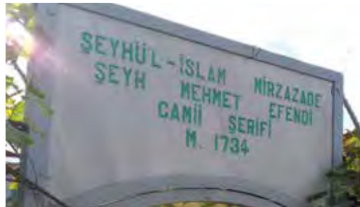
Fotoğraf 46. Bu câmînin adı da Arapça bir ad tamlaması içermektedir. Osmanlı Türkçesi dönemi câmîsi olduğundan bu türden yazılış mümkündür. Fakat burada da Mehmet adı -t ile yazılmıştır, "câmîi şerifi" yazılışı da yanlışdır