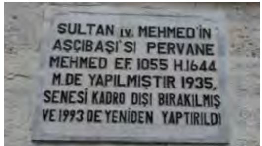
Fotoğraf 39. Aşçıbaşı Cämii'nin küyesinin bulunduğu tabela, gördüklerimizin içinde en yakışksız ve Türkçesi en kötü olanıdır