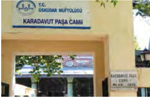
Fotoğraf 28. TDK Yazım Kılavuzuna göre baştaki lakaplar ayrı, addan sonra gelen lakaplar bitişik yazılmalıdır. Burada ise tam tersi bir durum söz konusudur. Üstelik bir yerde Davut, bir yerde Davud yazılmıştır