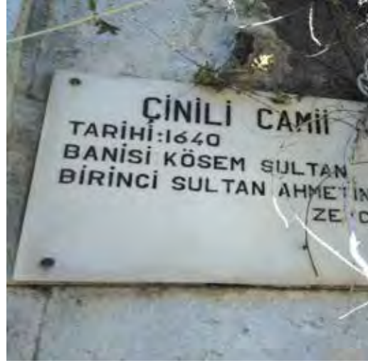
Fotoğraf 9. Görüldüğü gibi, bu câmînin adı Türkçe dil bilgisine uygun yazılmamıştır. (Biz bu çalışmayı yaptığımızda câmînin restorasyonu devam ediyordu; câmî ibadete ve ziyarete kapalı idi)

dır. Mesela, İstanbul Müftülüğünün internet sitesinde ve İstanbul metrosunun kapalı devre yayın ekranında günlerce dönen bir çalışma ile ilgili bilgilendirme reklamında Eminönü'ndeki Yeni Câmî adının Yeni Câmii şeklinde yazıldığına tanık olduk. Oysa câmî kelimesi ancak Türkçe belirtisiz ad tamlaması yapılıırken iki i ile yazılır. Belirtisiz ad tamlaması; tamlayan adın eksiz, tamlanan adın ise üçüncü şahıs iyelik eki almış şeklidir. Burada tamlayanın tamlanana bağlılığı belirsiz; fakat süreklidir. Belirtisiz ad tamlamaları dilimizde çeşitli adlar; özellikle tür, âlet, aygıt, makam, kuruluş görev adı olan birleşik adlar, benzetme vb. özellikli daha başka adlar kurmaya elverişlidir. 29 Demek ki belirtisiz ad tamlamasıyla kurulmuş birleşik adlar birer cins adı olabildiği gibi özel ada yakın bir özelliğe de sahiptir. Belirtisiz ad tamlamasında, tamlanana getirilen iyelik üçüncü tekil şahıs eki iki türdür. Tamlanan ünlü ile bitiyorsa -sı/-si/-su/-sü; ünsüz ile bitiyorsa -ı/-i/-u/-ü ekleri getirilir: Gül bahçesi, Üsküdar Belediye-si, Beykent Üniversite-si, 15 Temmuz Şehitler Köprü-sü; baba ev-i, kış güneş-i, yaz yağmur-u vb.