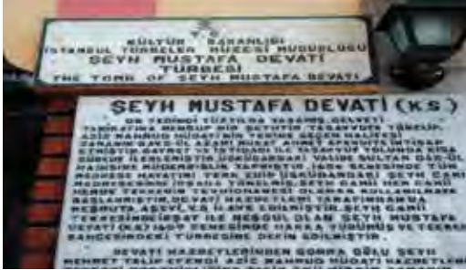
Fotoğraf 36-37. Üsküdar'ın orta yerinde bulunan cämi ve türbe çok daha güzel, yeni ve buranın kutsiyetine yakışır tabelalar hak ediyor