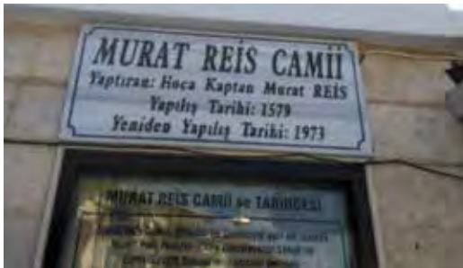
Fotoğraf 31. Üstteki künye kısa ve yetersiz, altındaki oldukça uzun