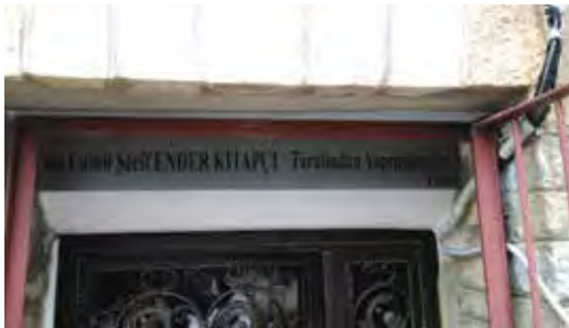
Fotoğraf 45. Aynı yazım yanlış burada da söz konusudur. Üstelik câmîyi yaptıranın adı Şerif Ender Kitapçı da olabilir. Bir önceki fotoğrafta soyadı Kitapçı şeklinde yazılmıştır