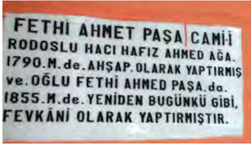
Fotoğraf 40. Burada da birden çok ve başka türlü yazım yanlışları ile özensizlik göze çarpmaktadır