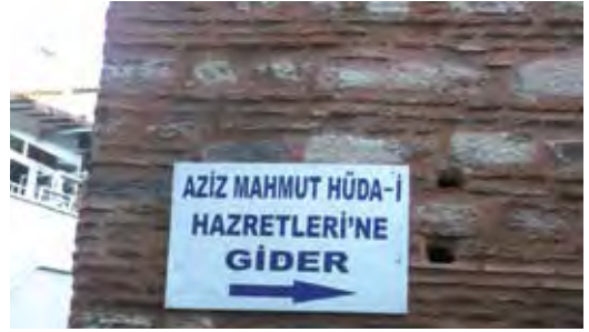
Fotoğraf 19. Buradaki yazılış, izah edilemeyecek kadar yanlış ve özensizdir