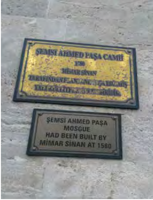
Fotoğraf 33. Üsküdar'ın en gözde Cämilerinden biri nam-ı diğer Kuşkonmaz Cämii...Üstteki tabela okunmayacak derecede eski, alttaki tabelanın İngilizcesinde yanlış var. Bu Cämi, konumu itibariyle yabancı turistlerin de daima ilgisini çekmektedir