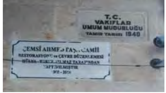
Fotoğraf 34. Aynı cäminin cadde tarafına bakan kısmında bulunan iki tabela daha