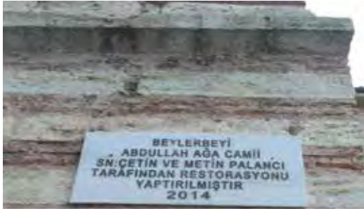
Fotoğraf 26. Aynı câminin adı aynı yerde iki farklı şekilde yazılmıştır