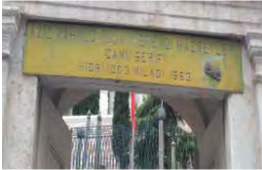
Fotoğraf 42. Aynı yanlış bu câmî adında da görülmektedir. Doğrusu, Câmî-i Şerif Aziz Mahmüd Hüdâî Hazretleri Camii şeklindedir