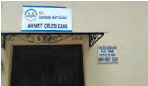
Fotoğraf 38. Lakap sonda bulunduğundan bitişik yazılmalıdır. Ayrıca cäminin küyesinin yazılı olduğu mermer tabletteki bilgiler eksik ve pek anlaşılılmaktadır. Tabletteki 'Açık Türbe'nin ne olduğunu cäminin tarihini bilmeyen anlayamaz