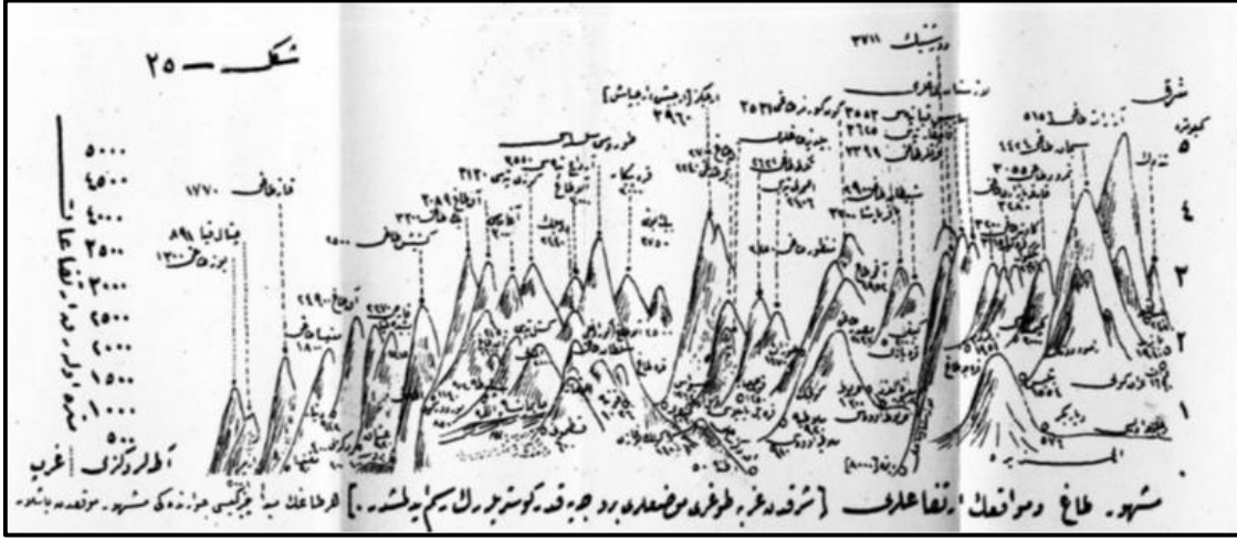
Şekil 2: Eserde Anadolu Topografyasının Genel Yapısını Gösteren Doğu-Batı Yönünde Çizilmiş Süperimpoze Profil Örneği