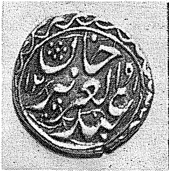
Yakub Beg'in Gümüş Parası (Abdul Aziz Han) 1291 H. (1874-5) No. 2066