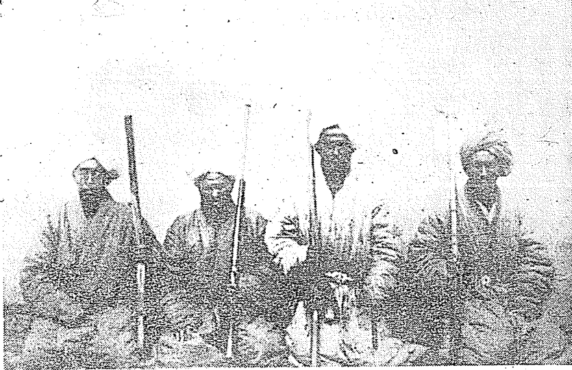
Yakup Beg'in Kaşgar'daki askerlerinden bir gurup (1874) Sir T.D. Forsyth "Report of A Mission to Yarkent" adlı eserden çekilmiştir