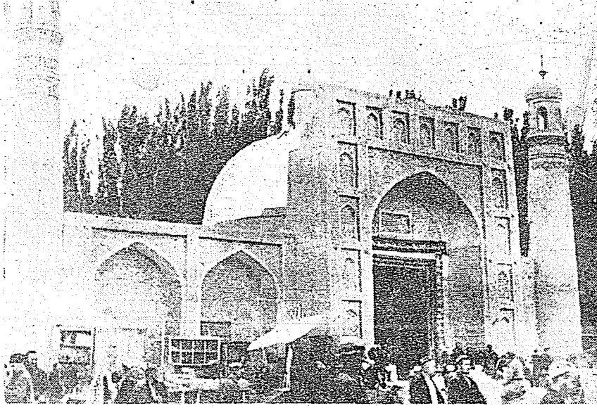
Yakub Beg'in Kaşgarda yaptırdığı Cami. (1874)