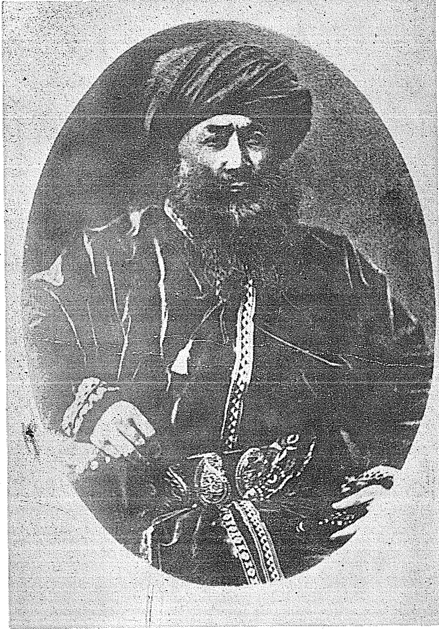
Kaşgar Emiri Muhammed Yakub Beğ