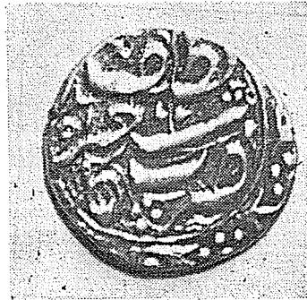
Duribe Latif Kaşgar 1291H. 1874-5) No. 2066.