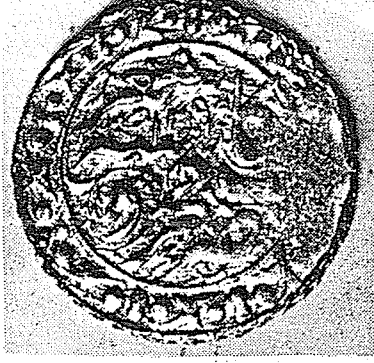
Duribe Mahruse Kaşgar 1290 H. (M.)1873) No. 2065 İst. Ark. Müzesi.