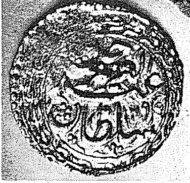
Yakub Beg'in Altın parası (Sultan Abdul Aziz Han) İst. Ark. Müzesi, No. 2065