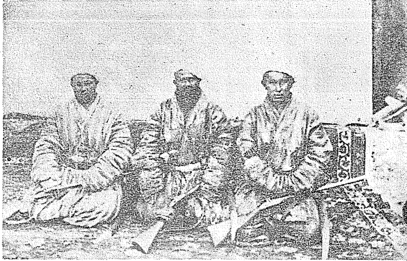
Yakup Beg'in Kaşgar'daki subaylarından bir grup (1874) Sir T.D. Forsyth "Report of A Mission to Yarkent" adlı eserden çekilmiştir