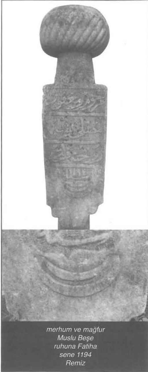
merhum ve mağfur Muslu Beşe ruhuna Fatiha sene 1194 Remiz