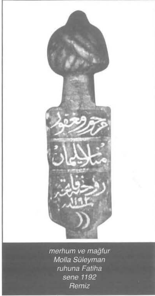
merhum ve mağfur Molla Süleyman ruhuna Fatiha sene 1192 Remiz