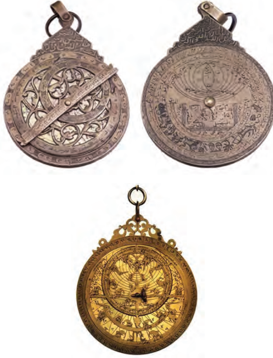
Resim 5: Usturlab Örnekleri