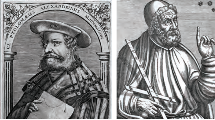
Resim 3: Batlamyus (Ptolemaios, Ptolemy)

Batlamyus'un (Ptoleme) 3 (m.108-168) Kitâbü's-Semere 4 adlı astrolojik eserini Arapçaya tercüme ettirmiştir Bu eser, İbnü'd-Dâye ve Nasîrüddin-i Tûsî tarafından şerhedilmiştir (Sezgin, 2007: 2/4). Böylece Müslümanlar daha hicrî birinci yüzyılın sonlarında Batlamyus'la tanışmış bulunuyorlardı. Ancak bu kitap bir astronomi kitabı olmadığından astronomi bilgilerine tam olarak ulaşmış olmuyorlardı.