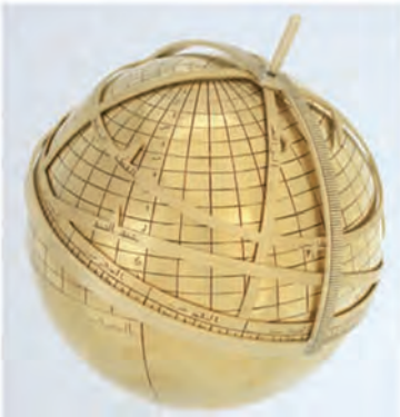
Resim 6: el-Bîrûnî'nin (ö.1048) küresel usturlabı