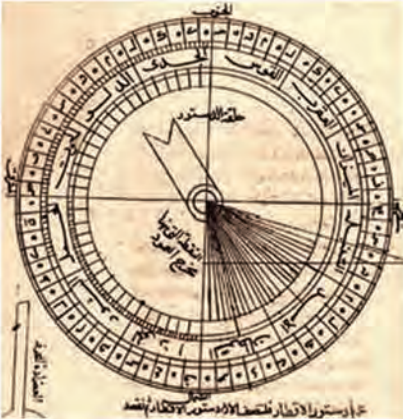
Resim 9: Usturlabın kenarlarının bölümlenmesi için kullanılan bir destür.

Ubeydullah b. Ziyâd zamanında Basra'da zaptiye teşkilâtının (şurta) reisliğini yapan Muhammed el-Fezârî aynı zamanda bir nahiv âlimiydi. Yazısı da son derece güzeldi. Yahya b. Hâlid el-Bermekî, "Dört kimse vardır ki sahalârında kendileri gibisi görülmemiştir: Hafîl b. Ahmed, İbnü'l-Mukaffa', Ebû Hanîfe ve Fezârî." demek suretiyle bu kişilerden sitayişle söz etmiştir. Düz ve silindirik usturlapları yapıp kullandığı bilinmektedir. Hindli astronomi bilginlerinden Brahmagupta'nın Siddhanta adlı eserini Zicü'z-Sind-Hind adıyla Arapçaya çevirmek suretiyle Hind astronomi geleneğinin İslâm dünyasına aktarılmasında ve tanınmasında önemli rol oynamıştır. İslâm dünyasında ay gözlemlerini yapıp hareketlerini ölçen ilk kişi olarak kabul edilir. Zicü'z-Sind-Hind 'in dışında astronomiye dair sekiz eseri bulunmaktadır (İzgi, 1995: 22/540-541), (Bayrakdar, 2012: 74-75).