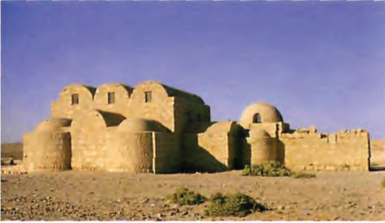
Resim 1: Kusayru Amre Sarayı'nın güneyden görünüşü

Emevîler envâ' ilmine sahip çıkmışlar ve Cahiliye döneminde bilinen yıldızları Kuseyru Amre Sarayı'ndaki hamamın kubbesine resmetmişlerdir. Ürdün'ün Amman şehrinin doğusunda bulunan Kusayru Amre Sarayı günümüze kadar gelen önemli kültür eserlerinden biridir (Balkaç, 2002: 16/461-462). Bu sarayın müstemilatından olan hamamın kubbesinde gökyüzü haritasını tasvir eden bir fresk bulunmaktadır. 1902 yılından itibaren Alois Musil'in makalelerinde ve monografilerinde ele aldığı 711-715 tarihli Emevî sarayındaki bu gök haritasının astronomi tarihi açısından önemine, Fritz Saxl ve Arthur Beer de dikkat çekmişlerdi. Söz konusu haritada, yaklaşık 400 yıldız, takımyıldızlar ve burçlar kuşağı (zodyak) koordinatlarıyla birlikte verilmiştir. Burada tasvirin modeline veya kaynağına ilişkin sorulara girmeksizin şu gerçeğe dikkat çekmek gerekiyor: Bu haritanın yapımcıları, kendilerini görevlendiren Emevî prensine gerektiğinde açıklamasını yapmak zorunda oldukları bir gök haritası meydana getirmişlerdir (Sezgin 2007: 2/3-4). Bu harita bilimsel amaçtan ziyade sanatsal zevk için yapılmış olmakla birlikte Emevîlerin astronomiyeye olan ilgilerini göstermesi bakımından önemlidir.