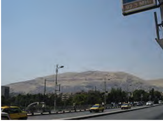
Resim 8: Kâsiyûn Dağı

güvenilir birer rehber olduğuna inanmaları yatmaktadır. Ancak ilmî araştırma hedefinin de önemli bir etken sayıldığı ve hassas gözlemlere dayanan yeni zîclerin düzenlenmesinin amaçlandığı da bilinen bir gerçektir (Aydüz, 2007: 34/456).