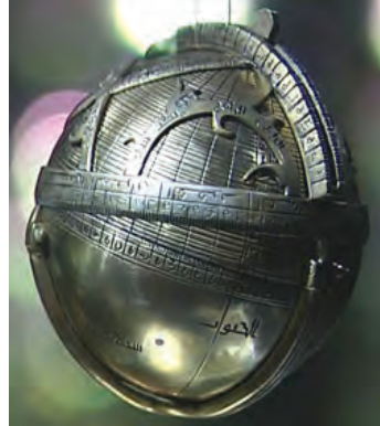
Resim 7: Musa adlı zatın küresel usturlabı (1480)