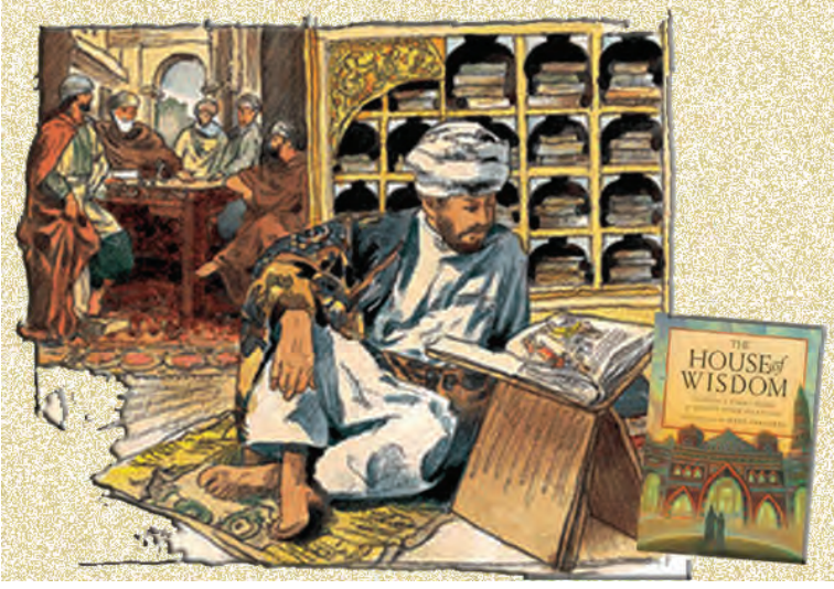
Resim 4: Beytülhikme