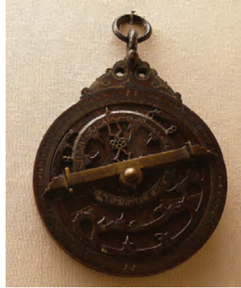
Resim 10: Bir düz usturlab