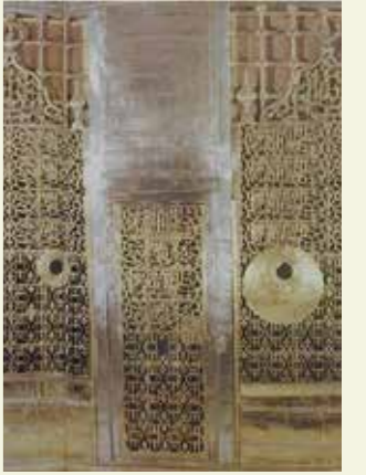
Hız. Ebubekir'in kabri

Hız. Ebû Bekir sahâbîler arasında Hz. Ali ile birlikte en güzel konuşan hatip olarak tanınır. Ebû Bekir'in çok tesirli konuşmaları fesahat ve belagat bakımından olduğu kadar muhtevalarının güzelliğiyle de ünlüdür.