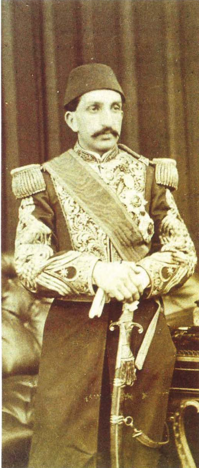
Sultan II. Abdülhamid

powers that is found in the Belgian constitution, the principle of the unification of powers in the Prussian constitution was adopted. This constitution was prepared by a committee in the Council of State, which was headed up by Server Pasha and included intellectuals like Namik Kemal and Seyfeddin Efendi from the kazasker rank. After defeat in the Ottoman-Russian War of 1877-78, Abdülhamid dissolved Parliament on 14 February 1878, and it was not reconvened.