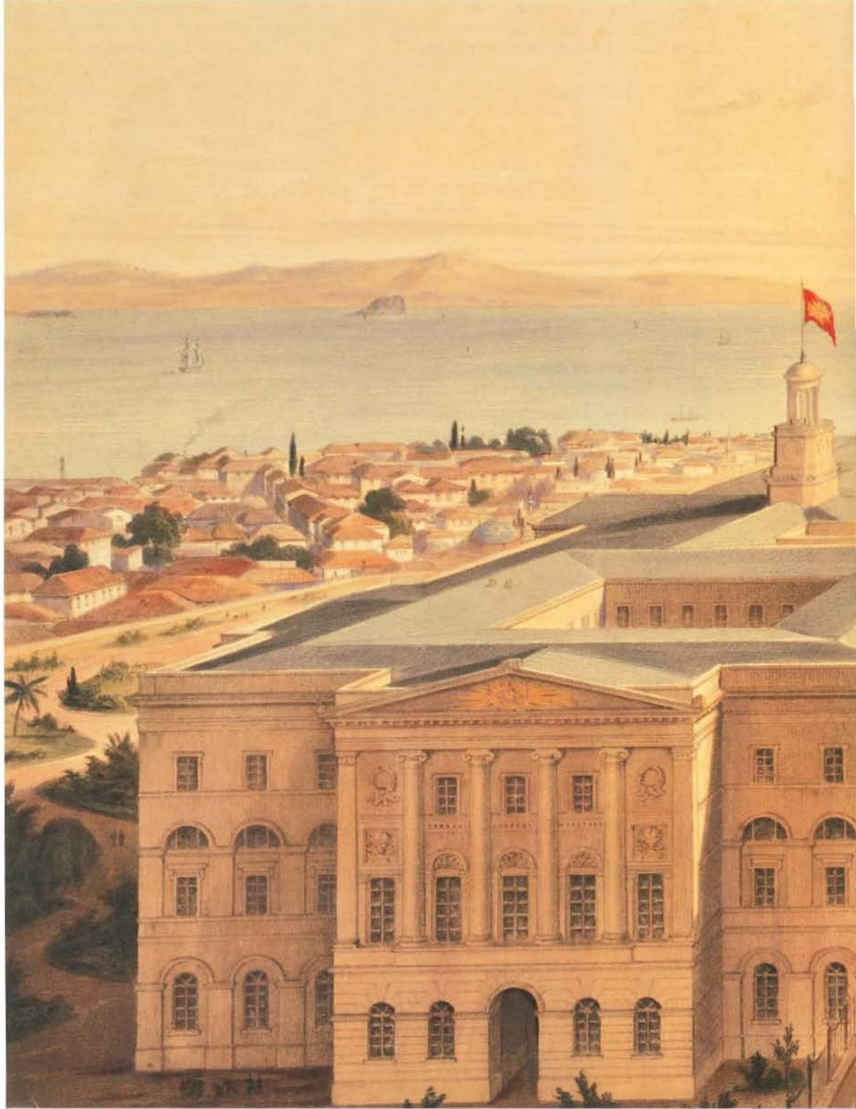
İlk Meclis-i Mebusan'ın toplandığı ve Adliye Nezareti olarak da kullanılan bina The building in which the first Meclis-i Mebusan was convened and which was used as the Ministry of Justice