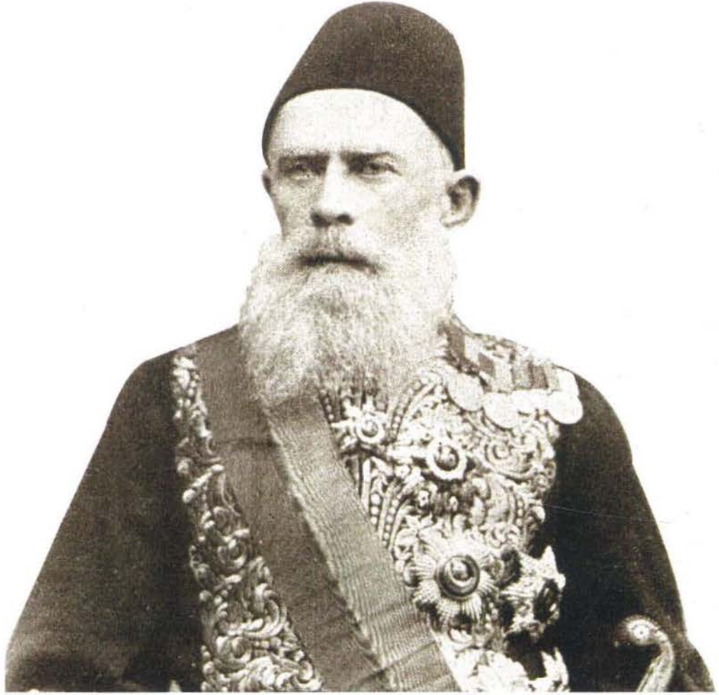
Ahmed Cevdet Paşa (Illustration)

Muhâkeme-i Medeniyye adıyla bir taslak da hazırlamıştır. Bu taslak daha sonra Usûl-i Muhâkeme-i Hukukiyye Kanunu 'na temel oluşturacaktır. Batı'dan alınan kanunların da tesiriyle olsa gerek Mecelle Cemiyeti'nin faaliyetleri giderek azalmış ve cemiyet 1306/1889'da tekrar toplan(ma)mak üzere tatil olunmuştur.