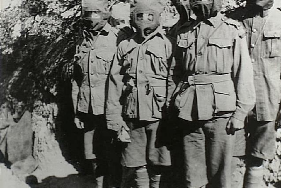
Şekil 2. Members of the 14th Battalion wearing their gas masks in Monash Valley. These masks were an early design and men in this area did not need to use them often as the Turks did not use gas or smoke during the campaign.

İngilizler tarafından çekilen yukarıdaki gaz maskeli askerlerin resminin altındaki İngilizce yazıda “aslında Türkler gaz kullanmadığından gaz maskesine gerek yoktu.” yazmaktadır. Gerçekten Türk tarafında böyle bir imkan yoktu. İngilizler muhtemelen kendi kullandıkları Zehirli-Boğucu gazdan bölgedeki rüzgar nedeniyle kendi personellerinin etkilenmemesi için gaz maskesi kullanmışlardır. Yukarıda yer alan belgelerden de anlaşıldığı gibi zayıatın fazla olmasında uluslararası hukuka aykırı olarak kullanılan Zehirli- Boğucu gaz kullanımının da etkili olduğunu değerlendiriyorum.