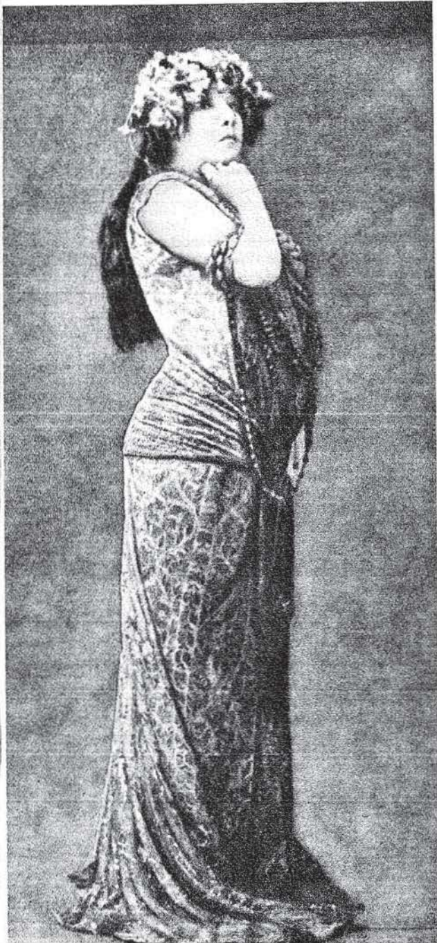
Ünlü Fransız oyuncusu Sarah Bernard.

E SKİ İstanbul'da yabancı tiyatro, opera faaliyeti çok gelişmişti. Beyoğlu'nda yabancı tiyatro ve opera topluluklarının temsilleri herhangi bir Avrupa başkentini aratmayacak zenginlikler gösteriyordu. Bazı yıllar, tiyatro toplulukları arasındaki rekabetten aynı gece, aynı eserin üç ayrı tiyatrodaki temsil edildiği olurdu. Önce yerli tiyatrolar eserleri görüyor, tanıyor, sonra da oynuyorlardı. Bir de bu topluluklardaki teknik uzmanlar, Türkiye'de kalıyor, yerli tiyatro topluluklarına yol gösteriyorlardı. Bu yazıda, dünyaca ün salmış büyük tiyatro oyuncularından bazılarının Türkiye'ye gelişleri üzerinde duracağız.