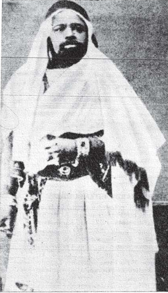
Meşhur zenci tiyatro oyuncusu Ira Aldridge.

tenkitçiler onu La Dame aux Camélias' da daha olgun bulmuşlardır.