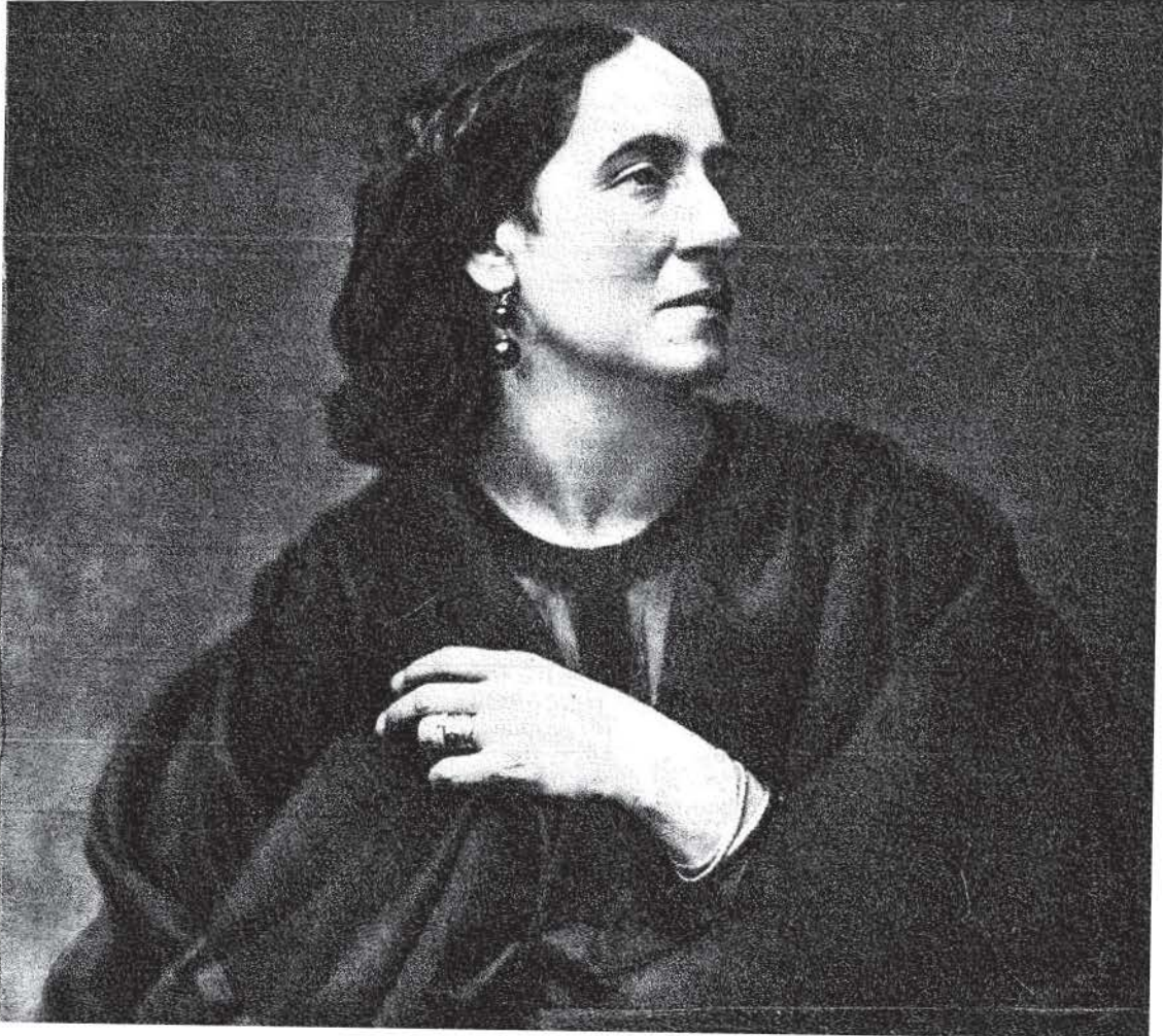
Ünlü İtalyan tragedya sanatçısı Adelaide Ristori.