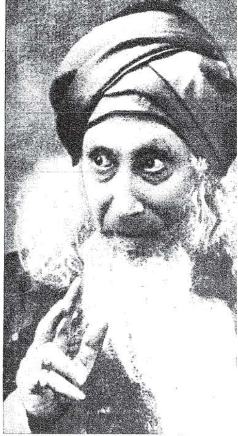
İtalyan Ermene Novelli, Shakespeare'in Venedik Taciri'ni II. Sultan Hamid'e oynamıştı.

1866 yılında İstanbul'a ünlü bir Shakespeare oyuncusu geldi. Amerikan asıllı bu zenci sanatçı İngiliz tabiiyetindeki Ira Aldridge (1804-1867) dir. Bugün Shakespeare'in doğum yeri Stratford-on-Avon'daki tiyatrodaki iskemlelerin üzerine çakılmış 33 ünlü Shakespeare oyuncusunun adını taşıyan plakalardan birinde Ira Aldridge'in adı yazılıdır. Sanatçının İstanbul'dan karısına yazdığı ve İstanbul'u anlattığı mektubu yayınlanmıştır. Aldridge 19 mart 1866'da İstanbul'a gelmiş ve Fransız Tiyatrosu'nda 22 martta Othello'yu oynamıştır. Yalnız bu temsilde Aldridge İngilizce, öteki oyuncular Fransızca konuşmuşlardı. Desdemona'ya, Fransız Mille Desterbecq çıkmıştır. Temsili İngilizce bilmeyenler bile çok beğenmiştir. 27 martta tiyatro tıklım tıklım dolmuştur. Aldridge, ayrıca Venedik Taciri ile Macbet'i de oyna-