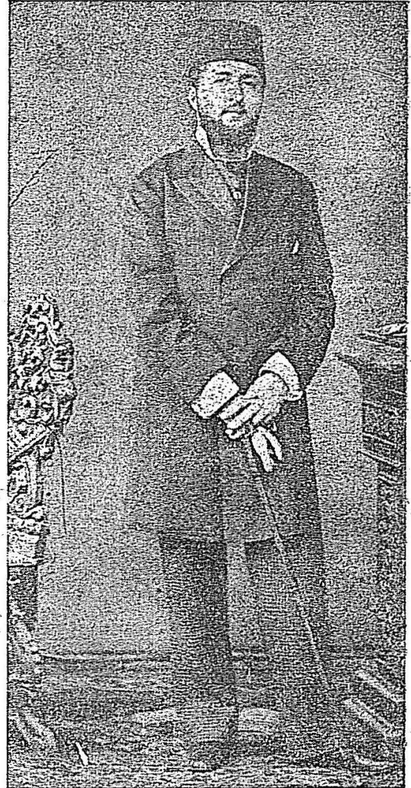
İzzet Fuad Paşanın gençlik resimlerinden biri