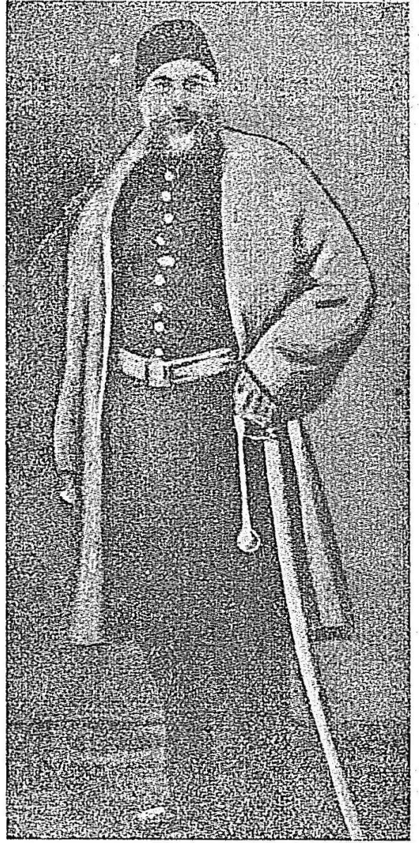
Keçeci Zade İzzet Fuad Paşa

Nükteleri ve hazırcevaplığı ile meşhur olan Keçeci Zade İzzet Fuad Paşanın bu sahifede güzel fıkralarını okuyacaksınız. Fuad Paşa, büyük siyasî hâdiselerde rol oynamış bir diplomatımızdır.