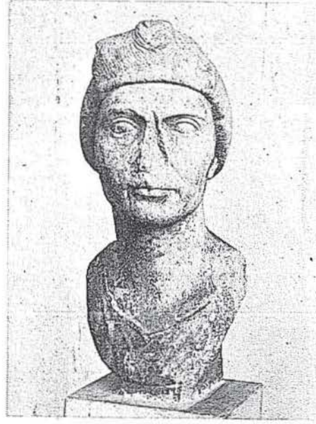
İmparator Augustus'un kardeşi Oktaviya'nın portresi.

Mezar taşlarının üzerindeki önemli bir özellik de, ölüye duyulan saygının ifade