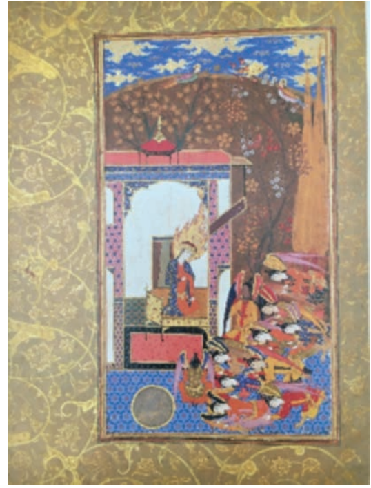
Resim 24: Meleklerin Hz. Adem'e Secdesi, Habib'üs-Siyer , TGM, No. 2237 (Rajabi, 2011, s. 187).

Taberî'de şeytanın cennete girişi ile ilgili benzer hikâye anlatılır. Yalnız burada iblisin cennete yılanın ağzında girdiği belirtilmiş, sonra yılanın ağzından çıkarak Âdem'e gözükmüş ve önce Havva'yı, sonra da Âdem'i kandırdığı anlatılmıştır. 58 Bütün bu metinler, nakkaşların şeytan tasvirlerinde kılavuz olmuştur. Bu konuyla ilgili sahneler Hadikatü's-Süeda 'nın resimli kopyalarında sıklıkla betimlenmiştir. Bunlar Süleymaniye Kütüphanesi (F.4321, y.9a) Türk İslam Eserleri Müzesi (T. 2967, y. 80) (Resim 25), British Museum (Or. 7301, y. 7b.) ve Paris Bibliotheque Nationale'deki (Sup. Turc., 1088, y. 9b) elyazmalarının içinde yer alır. SK, BM ve TİEM'deki minyatürler çok küçük farklarla birbirinden ayrılırlar. Kompozisyonun merkezindeki başları haleli Hz. Âdem ile Hz. Havva, metinde belirtildiği gibi incir yapraklarından oluşan etekleriyle çıplak olarak, cennet kapısından çıkarken gösterilmiştir. İblis ise sahnenin sol alt köşesinde, sanki cennetin dışına