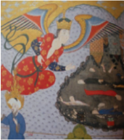
Resim 3: Sodom kentini üzerine kaplayan melek, Zübdetü't-Tevarih . TİEM, 1973 (And, 2007, s. 210).

dinî-tarihi-edebî bir tür olarak ortaya çıkan Kısas-ı Enbiya 'lardan 24 Nişapuri'nin (ö. 1035) kaleme aldığı, 1570 sonları 1580 başlarında İstanbul ya da İran'da Safevi döneminde hazırlandığı düşünülen bir nüshasında (TSMK H. 1228, y. 3b) (Resim 2) Âdem ile Havva'nın cennetten kovulma sahnesinde 25 melek, başında sorguçlu sarığı ve süslü elbiseleriyle, insan biçiminde betimlenmiştir (Farhad ve Bağcı 2009, s. 213).