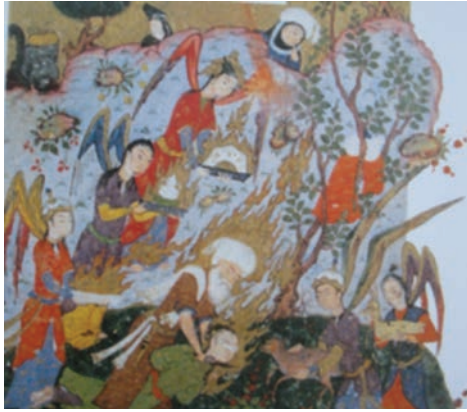
Resim 22: Hz. İbrahim'in Oğlunu Kurban Etmesi, Hadikatü's Süeda , PBN, supp Turc. 1088, y. 20a (And, 2007, s. 153).