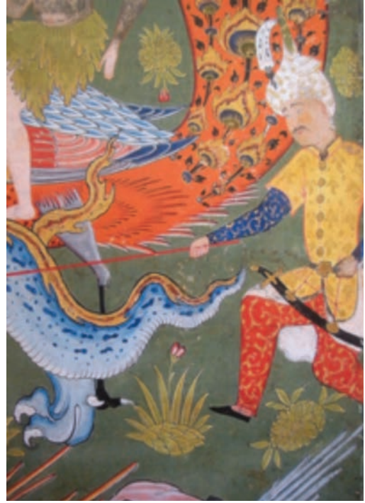
Resim 1: İnsan biçiminde bir melek, Falname , Arthur M. Sackler Gallery, Washington D.C., s1986, y. 251a (Farhad ve Bağcı, 2009, s. 98).

Örneğin 1550 sonları 1560 başlarında Kazvin'de hazırlandığı düşünülen bir Falname nüshasında (Arthur M. Sackler Gallery, Washington D.C., s1986, y.251a ) (Resim 1) (Farhad ve Bağcı, 2009, s. 98) ve geçmiş peygamberler ve Hz. Muhammed'in hayatını menkıbelerle süsleyerek anlatan