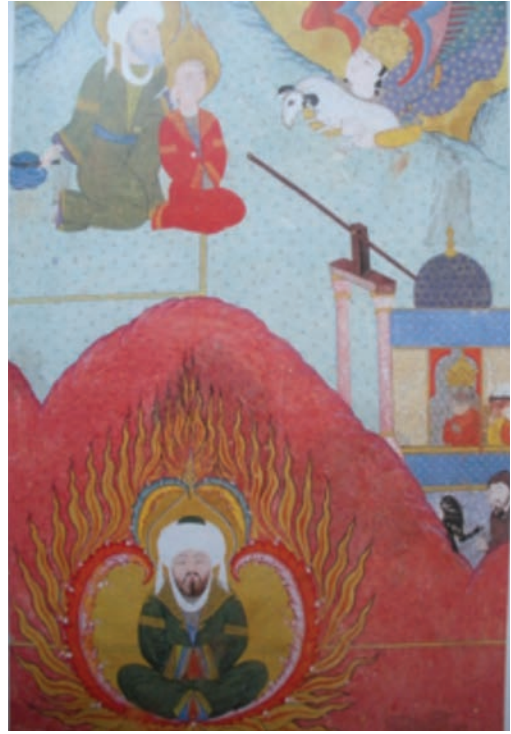
Resim 26: KHZ. İbrahim'in Ateşe Atılması, Zübdetü't Tevarih , TİEM 1973, y. 266a, (And, 2007, s. 151).

itilmiş gibi yılan ve tavus kuşu ile birlikte verilmiştir. Şeytan kara ve kuru başında kırmızı bir başlıkla verilmiştir. TİEM'deki şeytan görülmekle beraber, SK'deki şeytan tasviri tahrip edilmiştir.