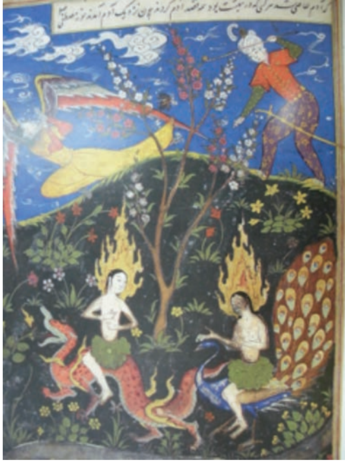
Resim 2: İnsan biçiminde bir melek, Nişapuri'nin Kısas-ı Enbiya TSMK H. 1228, y. 3b (Farhad ve Bağcı, 2009, s. 213).