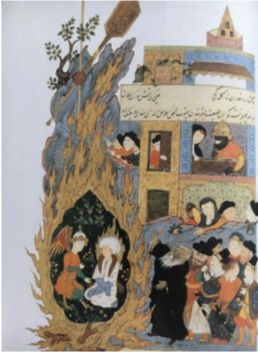
Resim 16: Hz. İbrahim'in Ateşe Atılması, Hadikatü's Süeda , PBN 1088, y. 17a (And, 2007, s. 158)