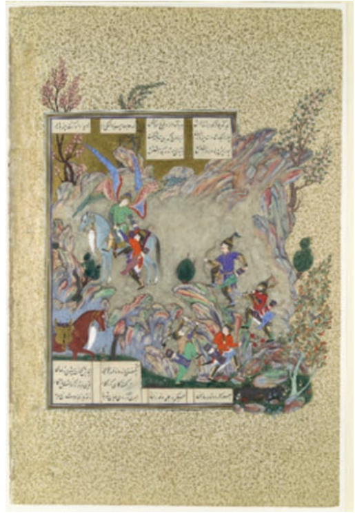
Resim 10: Melek Surûş'un Hüsrev Perviz'i kurtarması, Firdevsî Şehnâmesi , Tebriz, 1530-35, 1970.301.73, y. 708 b ( http://www.metmuseum.org/art/collection/search/452182 ).

İran hükümdar ve kahramanlarının gerçek ve efsanevî hikâyelerinin anlatıldığı Şehnâme adlı eserinin, Tebriz'de 1530-35 yıllarına tarihlendirilen ve Safevî hükümdarı Şah Tahmasp'a (ö. 1576) sunulan kopyasında yer alır. 34 Burada melek Surûş, Bahram Çubin'den kaçan Hüsrev Perviz'in dar bir geçitte sıkışması ile Tanrı'ya dua etmesi sonucu, yardım elini uzatarak onu bu zor durumdan kurtarmıştır. Metinde meleğin beyaz bir ata bindiği ve üzerinde de yeşil bir elbise olduğu anlatılır. 35 Nakkaş da Surûş'u açık renkli bir at üzerinde yeşil renkli bir elbise ile betimleyerek metne sadık kalmıştır (Resim 10).