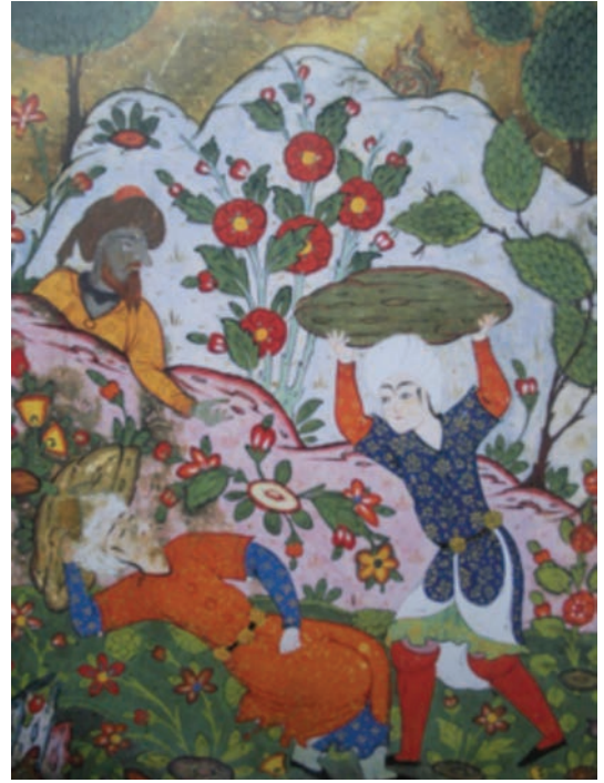
Resim 20: Rahip Barsisa'nın şeytan ile son kez konuşması, Sadi, Külliyat , TGM, No. 2174, (Rajabi, 2011, s. 131).