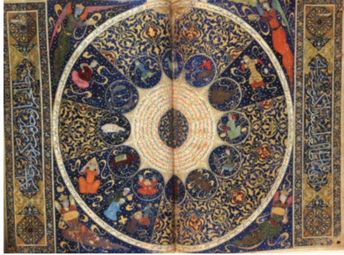
Resim 7: Takdim sayfasındaki melek tasvirleri, Galen, Kitabül Tiryak , 1198-99, PBN, Arabic 2964, y. 36 (Grabar, 2009, s. 55).)