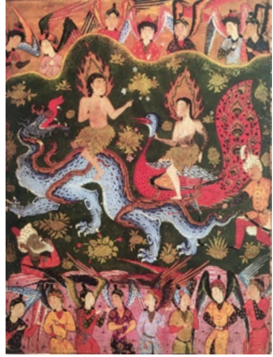
Resim 14: Hz. Âdem ile Hz. Havva'nın Cennetten Kovulması, Falname , Arthur M. Sackler Gallery, Washington D.C., s1986, y.251a (Farhad ve Bağcı, 2009, s. 98).

Bir diğer örnek ise, 16. yüzyılda, Kazvin'de hazırlandığı düşünülen bir Falname (Arthur M. Sackler Gallery, S1986.254) 41 kopyasında bulunur (Resim 13) (Lowry ve Nemazee, 1998, s. 126). Hz. Âdem ile Hz. Havva kompozisyonun ortasında ikisinin de başı haleli olarak, süslü bir taht üzerinde verilmiştir. Üstlerinde, ellerindeki tasta nur yağdıran iki melek görülür. Etraftaki meleklerden bazıları secde etmekteyken bazıları da hizmet etmektedir. Resmin sol üst köşesinde, tepenin gerisinde yaşlı ve sakallı bir adam kılığında betimlenen şeytanın ifadesi üzgün verilmiştir. Uzaktan onları izlemektedir. Cennetin dışında olduğu özellikle vurgulanmıştır. Başında sarık bulunur, ten rengi koyu, boynunda da yukarı doğru uzanan bir bağ görülür. 42