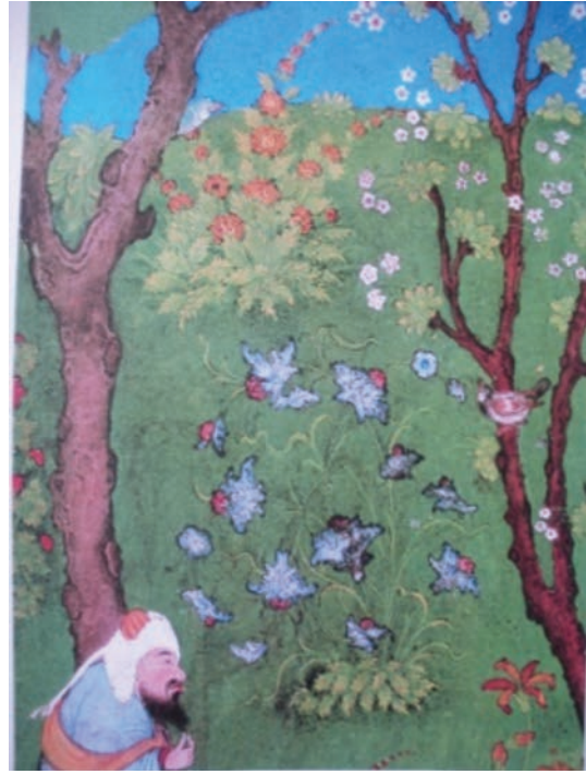
Resim 18: Şeytan'ın Kureyşli askerlere Hz. Muhammed ile Ebu Bekir'in gizlendiği mağarayı göstermesi, Siyer-i Nebi , TSMK H. 1223, y. 108a ( https://digitalcollections.nypl.org/items/510d47da-619c-a3d9-e040-e00a18064a99 ).