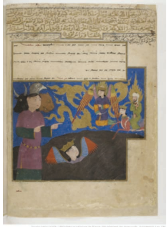
Resim 4: Dört başlı melek, Şah Ruh Miraçnamesi , PBN, supp turc.190, y. 32b ( https://gallica.bnf.fr/ark:/12148/btv1b8427195m/f70.item ; 31.03.2020)

Melek suretleri, özellikle edebî türde hazırlanmış resimli elyazmalarında, takdim sayfalarında tahtında oturan sultanı, hükümdarı ya da peygamberi korumak için ve metnin içinde ise iyiliği, doğruluğu ve ilhamı anlatmak için betimlenmiştir. Takdim sayfalarındaki bu tasvirlerde sayfanın üst kısmında genellikle nur saçan şekilde kanatlı olarak son derece süslü kıyafetler içinde ve cinsiyetsiz olarak betimlenirler 29 (Resim 6). Bazen de takdim sayfalarındaki bu kompozisyon, yazarların kendilerini göksel varlıkların yani ilahî güçlerin koruması altına alma isteği şeklinde yorumlanabilir. Örneğin, Pseudo-Galen'in (ö. 216) Hekim Andromakhos'un maceralarını anlattığı eseri, 12. yüzyılda İslam yazarları tarafından çevrilerek Kitabü'l-Tiryak 30 adıyla kopyaları hazırlanmış, bunlardan Paris nüshasında (Arabic 2964), dolunayın etrafını çevreleyen iki iç içe geçmiş yılan, bunlara eşlik