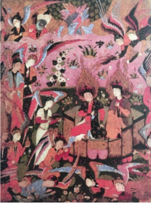
Resim 13: Meleklerin Cennette Hz. Âdem ile Hz. Havva'ya Hizmeti, Falname , Vever Collection (Lowry-Nemazee, 1988, s. 127).