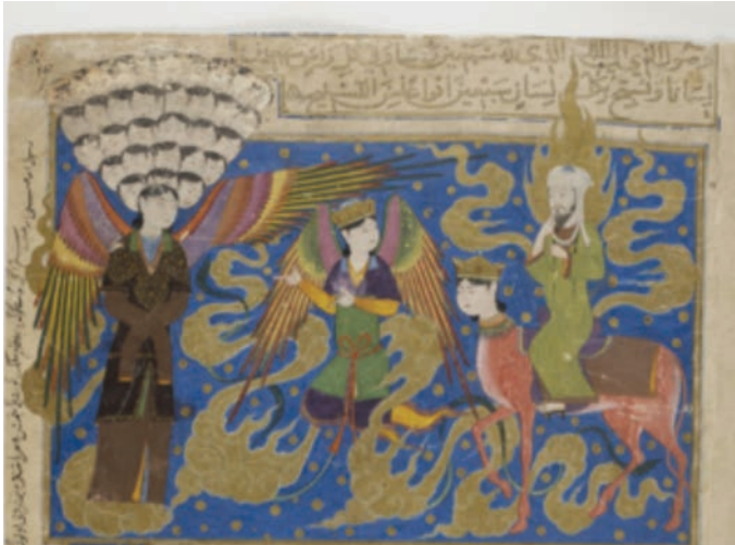
Resim 5: Bin başlı melek, Şah Ruh Miraçnamesi , PBN, supp turc.190, y.15a ( https://gallica.bnf.fr/ark:/12148/btv1b8427195m/f35.image 1.04.2020)