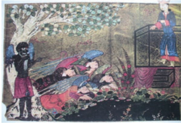
Resim 23: Meleklerin Hz. Adem'e Secdesi, Külliyyat-ı Tarih , TSMK B. 282, y. 16a (İnal, 1995, s. 119).

oğul isteyince Tanrı verir. Çocuk büyüyünce rüyasında onu boğazladığını görür. Oğluna bunu anlattığında çocuk karşı gelmez. Tam kurban edecekken melek bir kurban indirir. 52 Bir diğer Hadikatü's-Süeda kopyasındaki (PBN 1088, y. 20a) sahne ise kalabalıktır (Resim 22). İbrahim Peygamber ve oğlu İsmail başı haleli olarak sahnenin merkezindedir. İbrahim diz çökmüş olan oğlu İsmail'in boğazına bıçağı dayamış, o sırada gelen iki melek de ellerindeki kurbanları ona uzatmış biçimde betimlenmiştir. Burada farklı olarak koç gökyüzünden inmemiştir. Arkadaki üç melek hizmet halinde gösterilmiştir. İki figür ise tepenin gerisinden olayı izlemektedir. Şeytan sol üst köşede çok çirkin bir insan olarak tasvir edilmiş, farklılığı başlığı, teni ve tasma ile vurgulanmıştır.